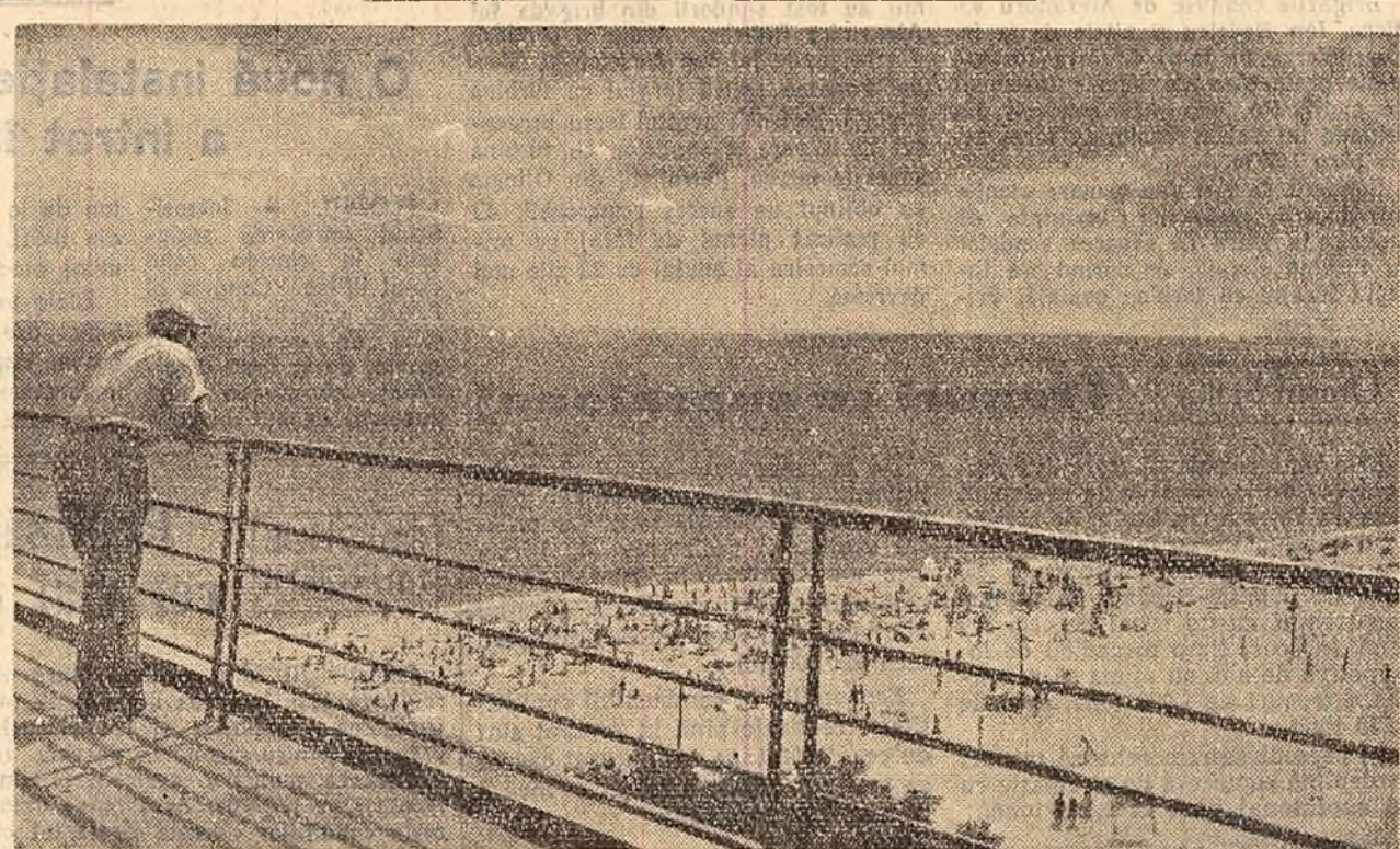
Primiile oaspeli pe litoral

Alți cursanți au arătat că numai prin recuperarea bronzului din zgură, colectivul secției turnătoriei a contribuit puțin acum cu economii de peste 200.000 lei la realizarea angajamentului luat de către muncitorii atelierelor în cinstea celui de-al III-lea Congres al P.M.R.