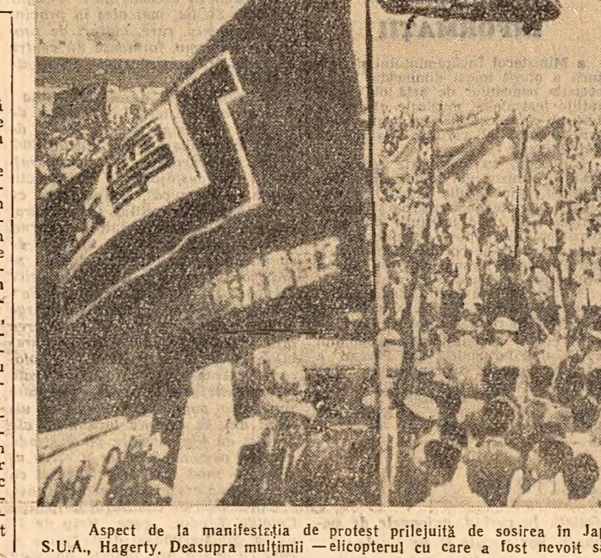
Aspect de la manifestația de protest prilejuită de sosirea în Japonia a reprezentantului președintelui S.U.A., Hagerly. Deasupra mulțimii — elicopterul cu care a fost nevoit să se salveze oaspetele nedorit.

WASHINGTON 14 (Agerpres). — După cum relatează agenția Reuter, comisia senatorială pentru afacerile externe a S.U.A., care urma să se întrunească la 14 iunie pentru a vota noul tratat și a-l înalța imediat în statutul de ratificare, a hotărît să amîne această ședință. Un purtător de cuvînt al comisiei a declarat că membrii comisiei au căzut de acord să aștepte mai întîi sosirea președintelui Eisenhower la Tokio unde, după cum subliniază Reuter, tratatul de securitate „este supus unor atacuri puternice” din partea poporului japonez.