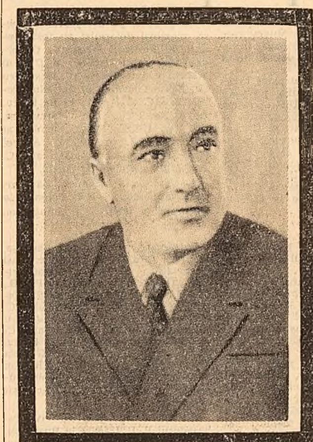
Harry Pollitt, președintele Comitetului Executiv al Partidului Comunist din Marea Britanie.

1933, partidul comunist a jucat un rol însemnat în mișcarea muncitorească și în anii premergători celui de-al doilea război mondial, comunistii englezi au militat pentru lărgirea și întărirea frontului unic de luptă împotriva fascismului. În perioada intervenției Germaniei hitleriste și Italiei fasciste împotriva Spaniei republicane (1936-1939), Pollitt a militat ferm în apărarea Republicii Spaniole. În anii războiului Partidul Comunist din Marea Britanie a luptat activ pentru mobilizarea oamenilor muncii în vederea înfringerii Germaniei hitleriste. În anul 1943 la Congresul al XVI-