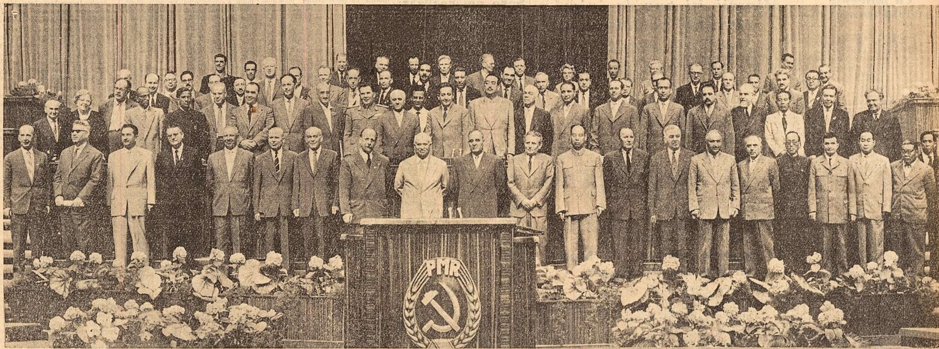
Reprezentanții partidelor comuniste și muncitorești frățești, împreună cu conducătorii partidului nostru, la încheierea lucrărilor Congresului al III-lea al P.M.R.

Sub steagul atotbiruitor al marxism-leninismului, sub conducerea Partidului Muncitoresc Român, înainte pentru îndeplinirea planului de 6 ani, pentru desă- vârșirea construirii socialismului în Republica Populară Română!