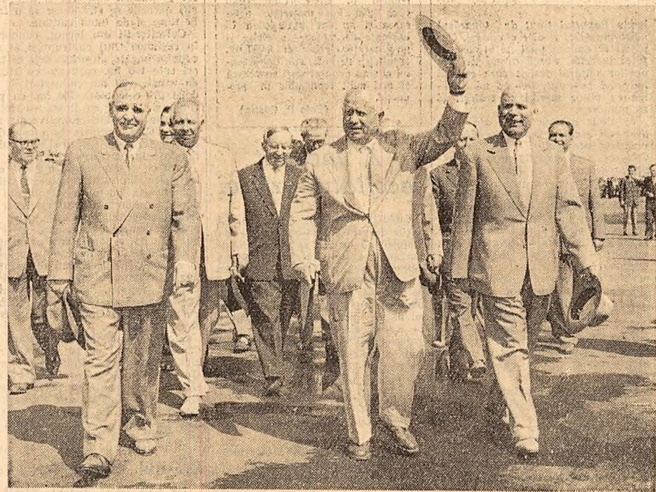
Pe aeroportul Băneasa, la plecarea delegației P.C.U.S.