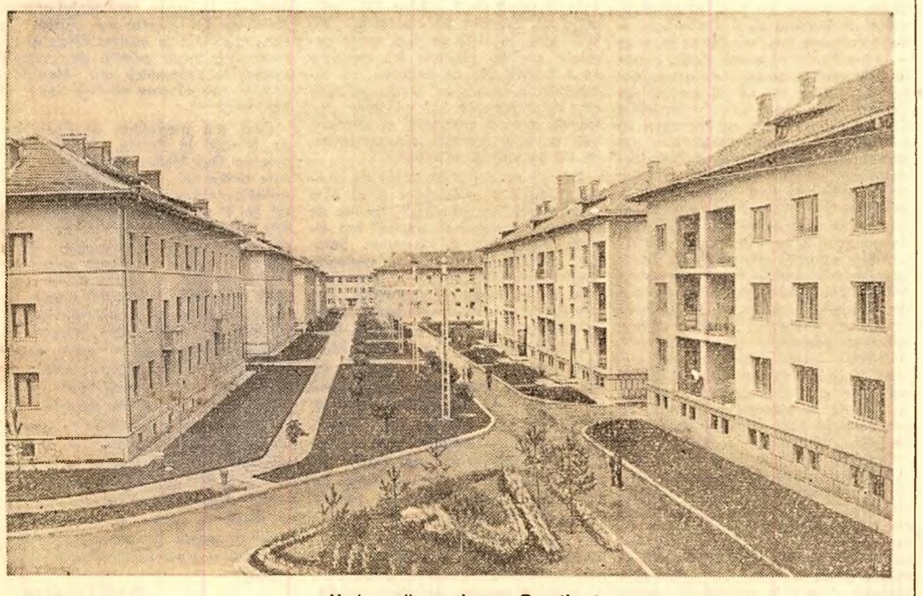
Vedere din noul oraș Onesti

azi. În continuarea acestei acțiuni, alte grupuri de sculptori și graficieni, au plecat ieri în centrele muncitorești Hunedoara și Reșița și pe șantierul Onesti. Artiștii plastici vor sta aici o lună de zile.