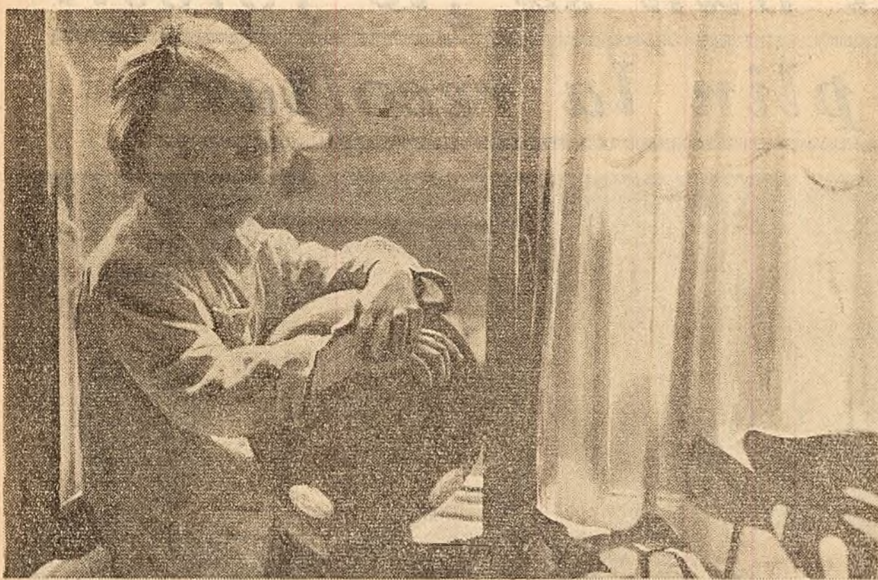
„La fereastră însoțită” (Foto GRELLA ANDREI, membru al cercului foto de la uzina „Encsel Mauriciu”-Tg. Mureș).