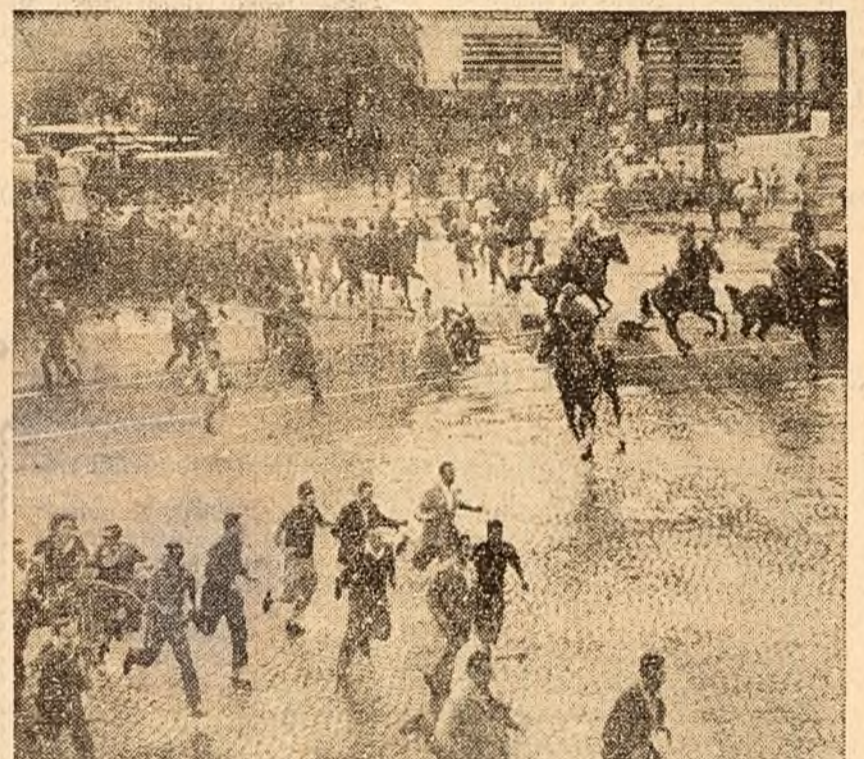
ROMA: Atacurile brutale ale poliției împotriva participanților la demonstrațiile antifasciste au stîrnit indignarea întregului popor italian.