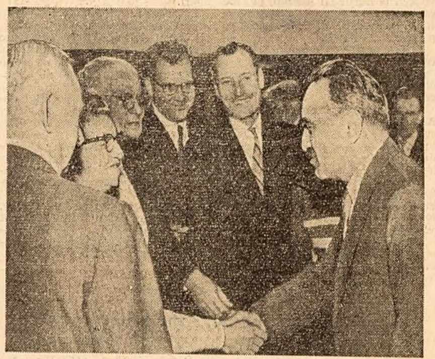
A. I. Mikolan primind la Kremlin un mare grup de turiști americani aflați în vizită în U.R.S.S.