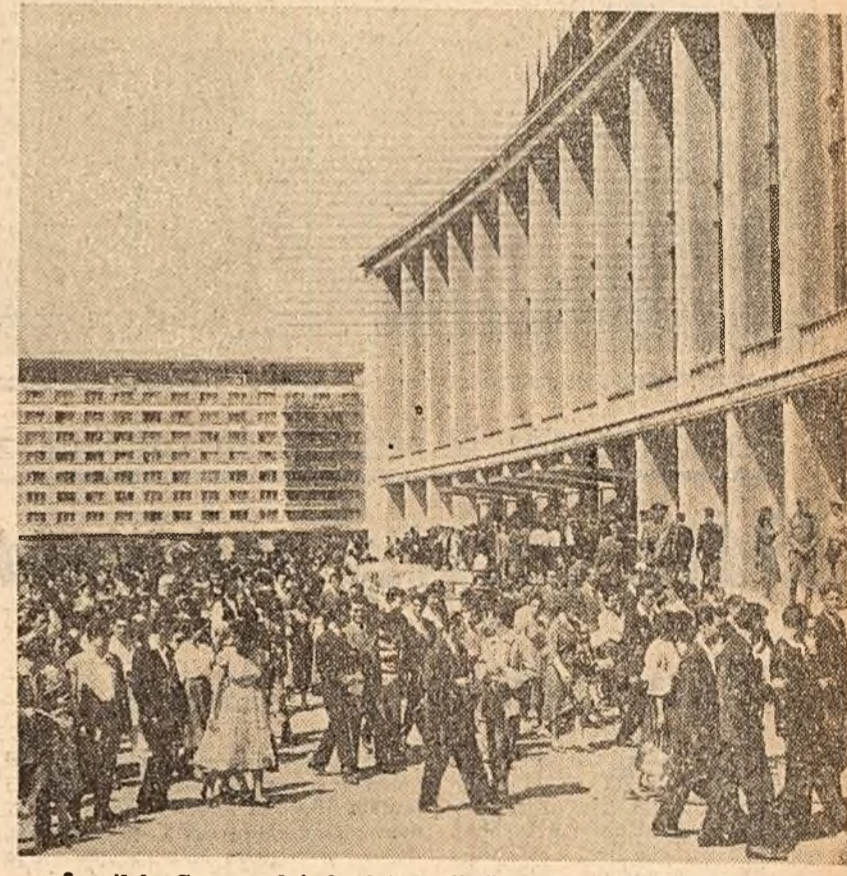
În zilele Congresului, în fața noii săli a Palatului R. P. Romine.

Încă o victorie strălucită a științei și tehnicii sovietice