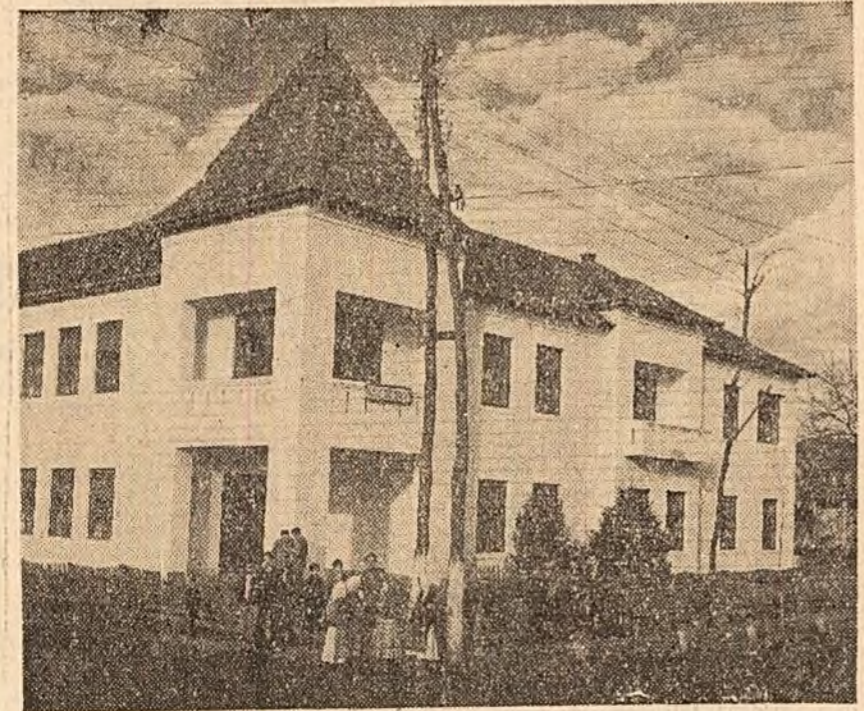
Școala medie din Negrești de unde fiii oșenilor pleacă spre universități și institute.

Am dormitat, îmbrăcat cum eram, într-un colț, lîngă cofa cu apă, ca-ntr-un post de veghe, și pînă s-a zărit de ziua