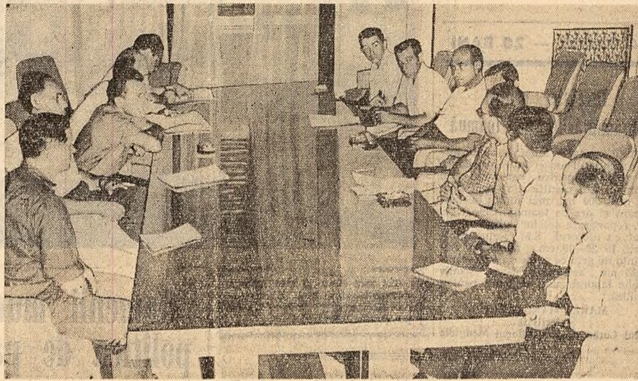
Un aspect din timpul consfătuirii

dere calitativ a materialelor este o problemă de prim ordin pentru scăderea rebeturilor în turnătorii. Dar ea este neglijată de forurile noastre tutelare. De aceea, uneori sîntem puși în situația să folosim materiale care nu corespund condițiilor din turnătoriile noastre.