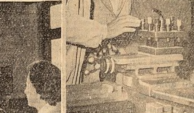
Orele de atelier n-au început din prima zi, dar curiozitatea nu cunoaște piedici. La 14 ani, strungul și privit ca un miracol, cu ochi flămnzi, de îndrăgosit. În 1963 acești proaspeți elevi ai școlii profesionale „Mao Tze-dun” vor fi strungari, frezori, lăcătuși, cazangii (fotografia din dreapta).

lele Timpele. A fost o zi de sărbătoare pentru cei aproape 1.000 de viitori muncitori”! O mie din cei peste 80.000 de ucenici înscriși anul acesta în școlile profesionale. La o școală nouă din Capitală i-am întrebat pe cei dintr-o I-a. — Ce-ai făcut azi la școală, voinicilor? — Am luat cărțile! A fost răspunsul lor spontan. Ieri, cei mai mici cetățeni ai patriei au aflat, la vîrsta de 7 ani, că grija le poartă poporul, ieri au cunoscut prima hotărîre de partid din viața lor. Flori și abecedar, cîntece și entuziasm. S-a simțit că e înția zi de școală de după istoricele hotărîri ale celui de-al III-lea Congres al partidului.