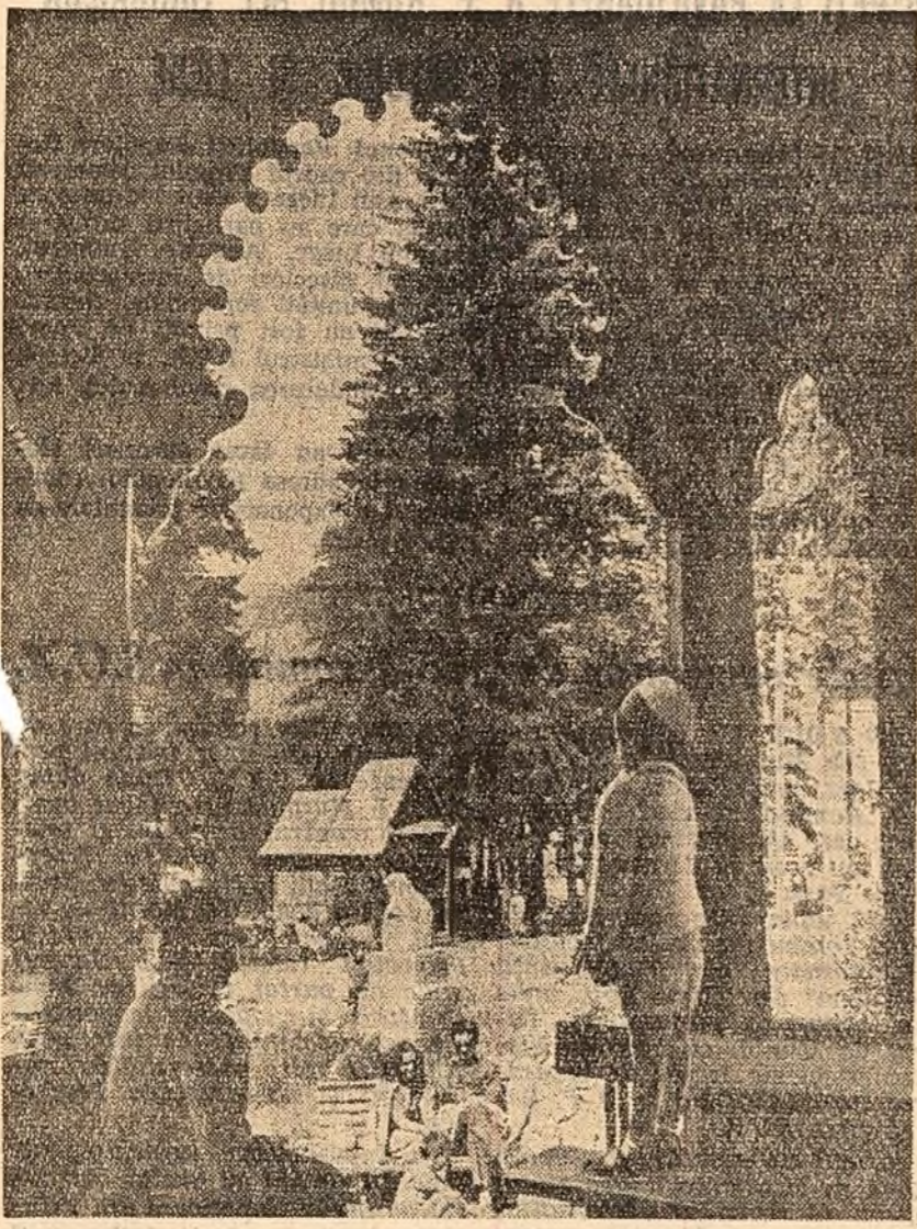
VATRA DORNEI. In parcul stațiunii balneo-climaterice.