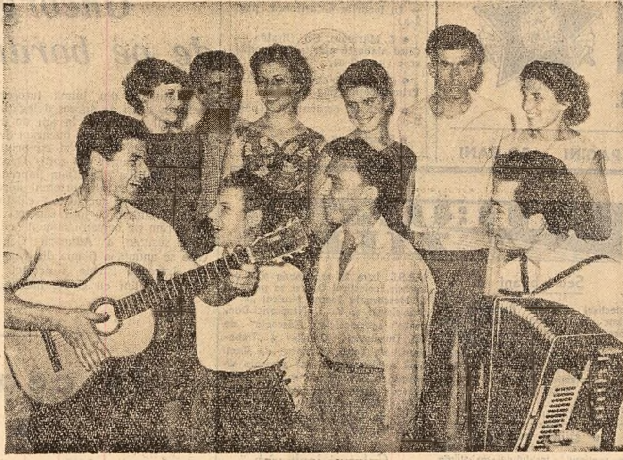
In curînd, un nou spectacol Brigada artistică de agitație din secția plantărie a fabricii de rulmenți din Birlad...

— Am putea face economii, am putea obține o viteză de foraj și mai