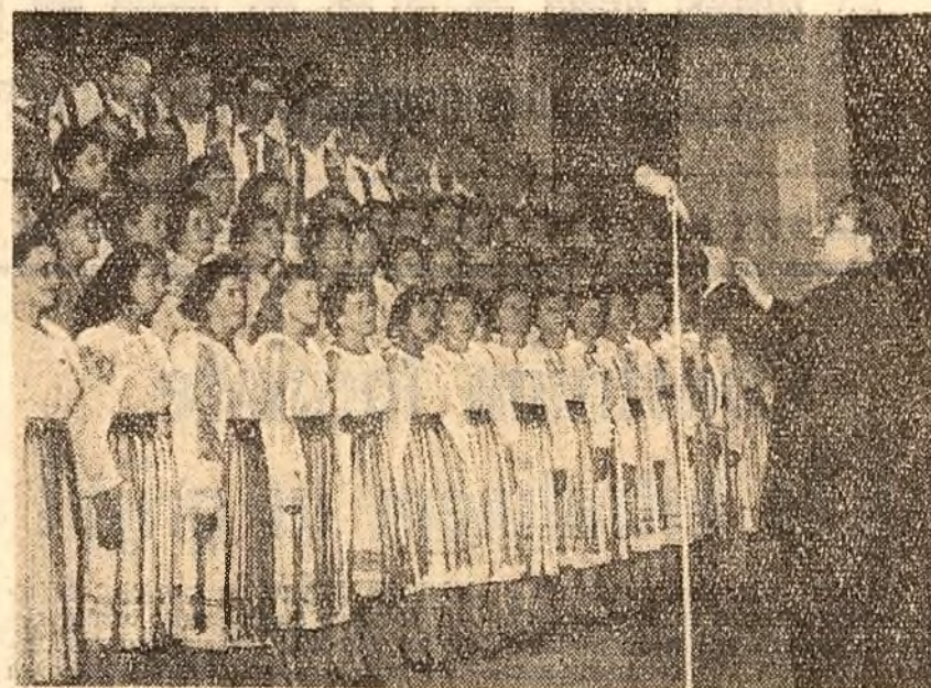
La vîrstă de 150 de ani corul „Ion Vidu” dă un concert festiv.

Sub stema Republicii, sub steagurile roșii și tricolorul fiind în bătaia vîntului, două cifre: 1810-1960.