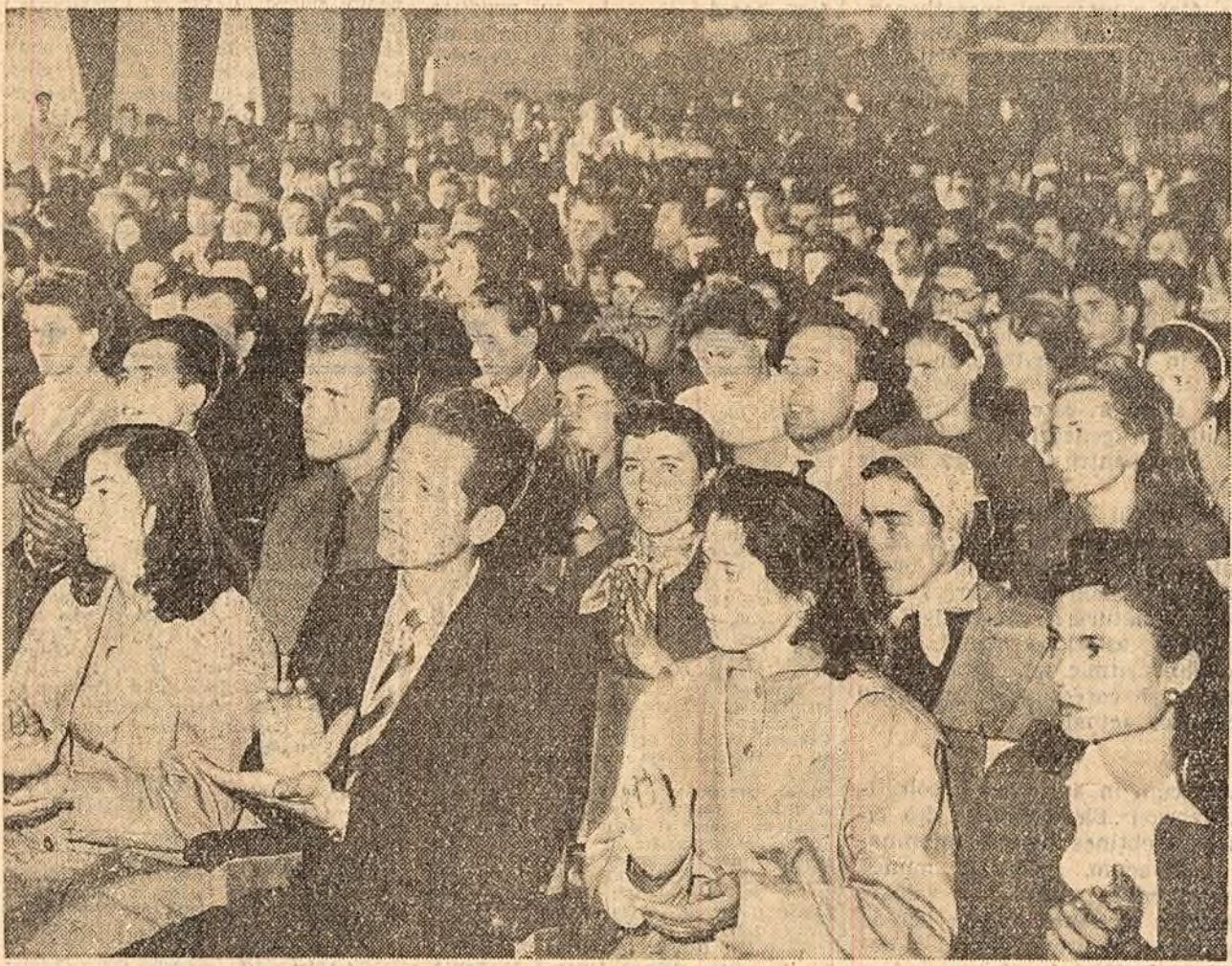
Într-o adunare însușită, tinerii din raionul „Gh. Gheorghiu-Dej” din Capitală și-au exprimat ieri după-amiază adunarea lor totală la politica de pace a partidului și guvernului nostru.

Doisprezece copii am adus pe lume. Două dintre ei mi-au murit de mîlt, dar pe zece dintre ei i-am ajutat să-și croiască drum în viață. Ca orice mamă, cînd mă gîndesc la viitorul lor, mă gîndesc la pace. De aceea nu-i de mirare că citind cuvîntarea tovarășului Gheorghiu-Dej la O.N.U., mi s-au umezit ochii. Într-adevăr, ce poate fi mai frumos decît o lume în care mamele să nu mai tremure că războiul le va răpi copiii? Dar pentru asta mamele de pretutindeni, femeile, trebuie să-și ridice glasul împotriva celor care, de dragul profiturilor, unețesc noi măceluri. Chemînd de la tribuna O.N.U. toate țările să arunce armele la fier vechi și să înlătore orice piedică din calea instaurării unei păci traimice în lume, tovarășul Hrușciov, tovarășul Gheorghiu-Dej și conducătorii celorlalte țări socialiste au vorbit de parcă s-ar fi sfîrșit mai înainte cu toate mamele din lume.