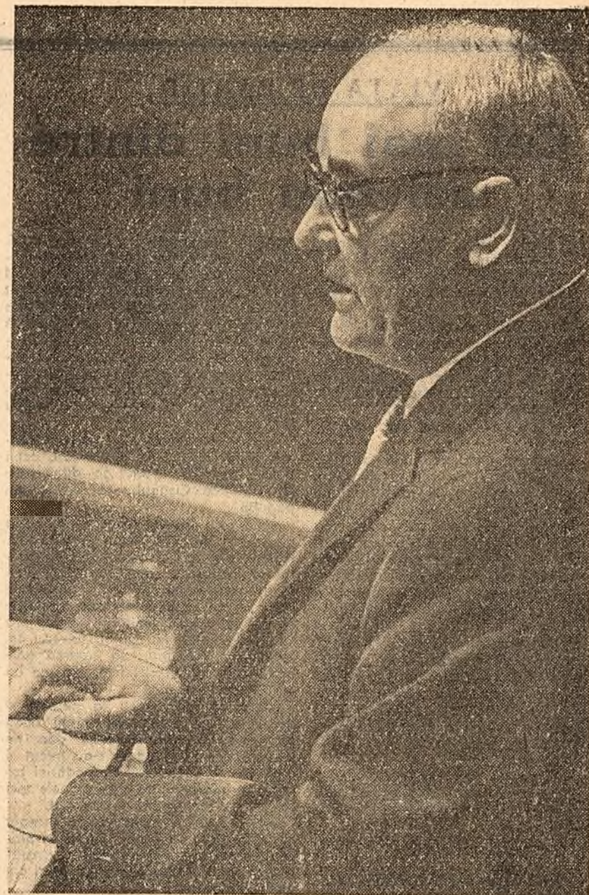
Tovarășul Gheorghiu-Dej la tribuna Adunării Generale a O.N.U.

Acum un sfert de veac, U.R.S.S. era singura țară socialistă. Azi în lume flutură puternicul lagăr socialist, a cărui existență exercită o înfrîngere determinantă asupra evoluției contemporane. Omenirea nu stă pe loc, ea merge înainte, spre socialism, spre bună stare, spre pace și nu există forță în lume care să poată oprii acest mers irezistibil înainte.