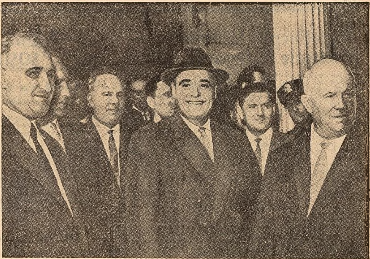
Un aspect de la sosirea invitaților la dejunul oferit de conducătorul delegației sovietice, N. S. Hrușciov în cinstea conducătorilor unor delegații la sesiunea O.N.U. În primul plan al fotografiei, de la stînga spre dreapta, tovarășii: Tudor Iivkov, Gheorghe Gheorghiu-Dej, Nikita Sergheevici Hrușciov. (Telefoto, de la New York)