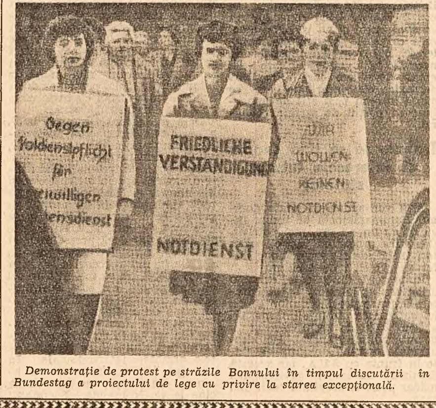
Demonstrație de protest pe străzile Bonnului în timpul discutațiilor în Bundestag a proiectului de lege cu privire la starea excepțională.

au devenit membru ale organizației. După cum a subliniat în cuvintarea sa tovarășul G.H. Gheorghiu-Dej, „Lărgirea cadrului Organizației Națiunilor Unite o apropiere de momentul când ea va deveni cu adevărat universală contribuind la întărirea autorității și eficacității ei. Creșterea numărului statelor membre în O.N.U. este privită însă cu răcoare de anumite cercuri din Occident, ceea ce reflectă starea de spirit a celui grup de state care este prezente în realitate o arată numeroasele semnale de alarmă pe care le trage în aceste zile presa burgheză. „Țările neutre se îndreaptă spre stînga... amenințind politica S.U.A. America și aliații ei se găsesc acum sub un contur baraj de artilerie, care se dă nu pe un front, ci pe două”, - a scris „Wall Street Journal”.