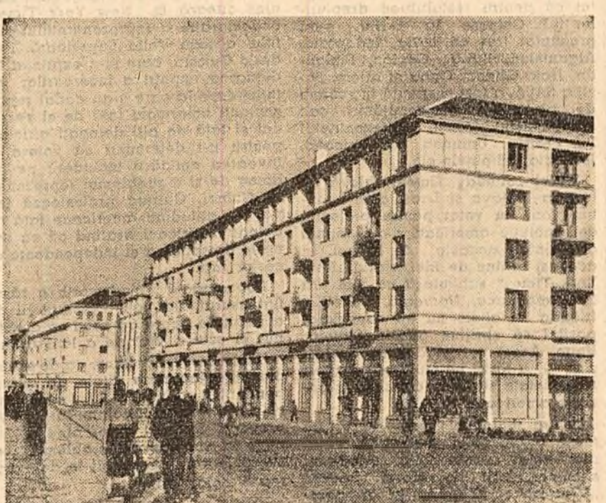
Not blocul de locuințe în Craiova.

Lucrările consfătuirii s-au desfășurat în spiritul colaborării socialiste și al înțelegerii reciproce.