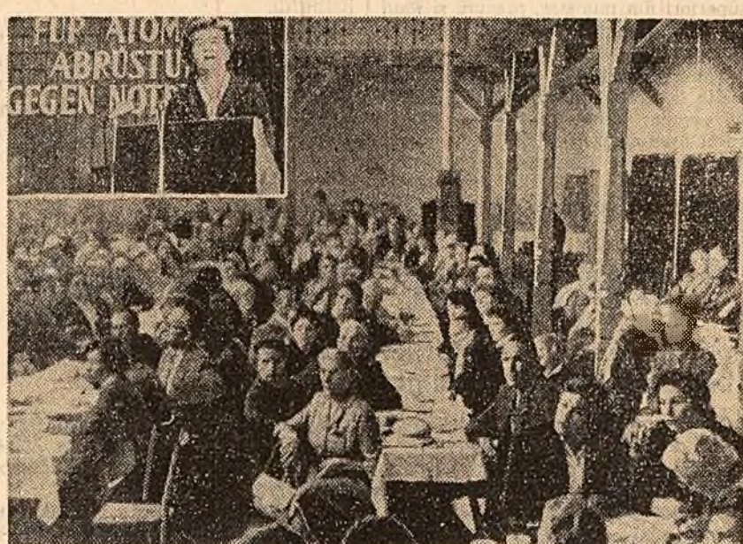
La Lübeck (R.F.G.) mișcarea pentru pace a femeilor din Germania Occidentală a organizat o mare demonstrație împotriva înarmării atomice a Bundeswehrului. 400 delegații din ambele state germane și numeroase delegații din Anglia, Danemarca, Suedia și Norvegia au participat la această demonstrație.

Fondul problemei nu se schimbă de pe urma faptului că guvernul R.F.G. ține seama de atitudinea negativă a opiniei publice mondiale față de pretențiile sale asupra teritoriilor altor state, încearcă să camufleze esența agresivă a politicii sale cu fraze despre revizuirea „pașnică” a problemei frontierei germane. Dar cine poate lua în serios aceste declarații, pe cine vor putea ele înșela? Guvernul R.F.G. are perfect de bine că statele la ale căror teritorii are pretenții nu vor accepta niciodată modificarea frontierelor lor în favoarea militaristilor ger-