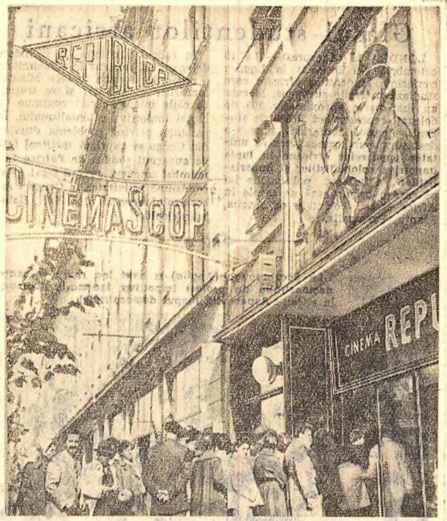
„La cinematograful „Republica” din Capitala, cetățenii așteaptă să rîd pentru a lua bilete la filmul sovietic „Nopti albe”.

Declarația tov. Mihai Petri despre participarea țării noastre la Tîrgul de mostre de la Marsilia