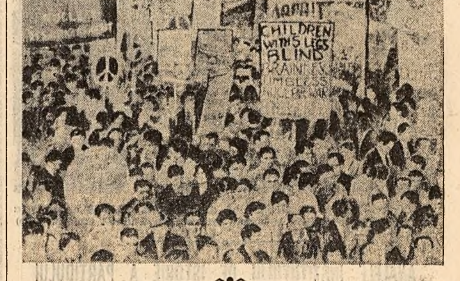
Aspectul din timpul demonstrației.