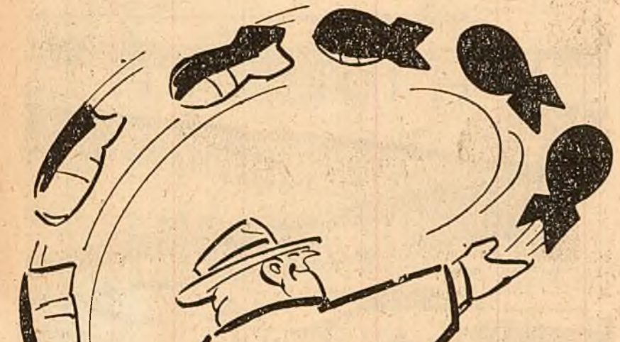
FABRICANTUL DE ARME: — Acesta este punctul meu de vedere în problema dezarmării. Desen de NELL COBAR

Delegatul Afganistanului a spus că Comitetul a primit propuneri importante în legătură cu dezarmarea generală și completă sub un control internațional eficient și că trebuie să ia măsuri concrete pentru înlăturarea acestor propuneri.