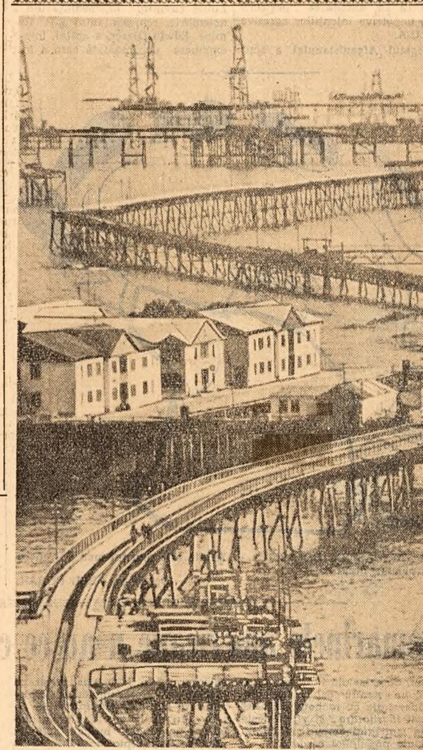
La „Pietrele petrolului”.

ATENA 3 (Agerpres). — TASS transmite: Ziarul „Avghi” anunță că petiția care cere eliberarea lui Glezos a fost semnată până acum de zeci de mii de persoane.