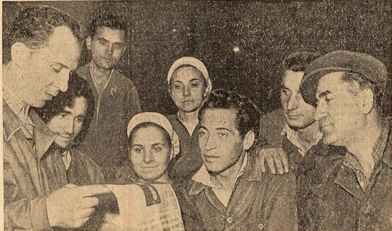
În pauza de dimineață, la Atelierele „Grivița Roșie”. Un grup de muncitori s-au strîns pentru a citi împreună expunerea tovarășului Gh. Gheorghiu-Dej cu privire la lucrările sesiunii Adunării Generale a O.N.U. și la activitatea delegației R. P. Romine.

tal, pe întreaga țară, mecanizatorii au făcut arături adînci pe circa 40 la sută din suprafețele prevăzute. Odată cu încheierea însămînțărilor tractoriști, îndeosebi cei din regiunile Hunedoara, Timișoara și Bacău, regiuni unde aceste lucrări sint rămase în urmă — trebuie să pornesc cu toate forțele la executarea arăturilor adînci și să manifeste mai multă grijă față de calitatea arăturilor.