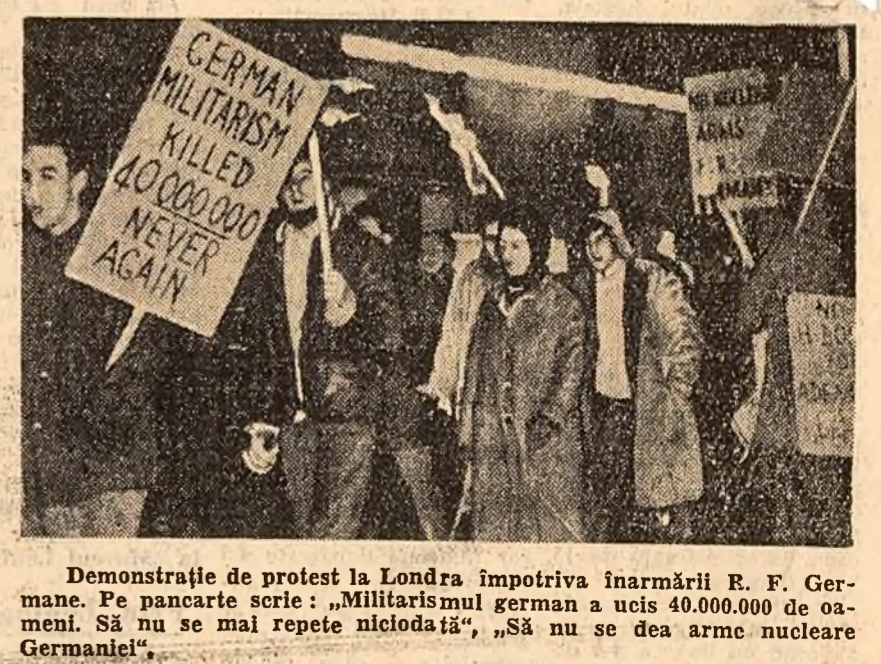
Demonstrație de protest la Londra împotriva înarmării R. F. Germane. Pe pancartă scrie: „Militarismul german a ucis 40.000.000 de oameni. Să nu se mai repete niciodată”, „Să nu se dea arme nucleare Germaniei”.

Agenția France Presse anunță că, cu puțin înainte de a muri, Felix Moumie a declarat că a fost