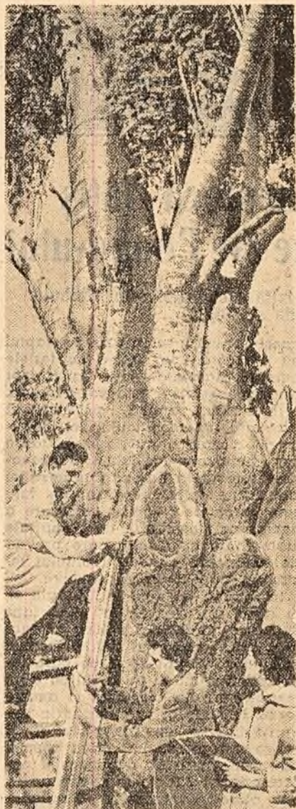
În orele de practică, studenții Facultății de Științe Naturale din Capitală aplică în Grădina botanică cunoștințele teoretice dobândite.