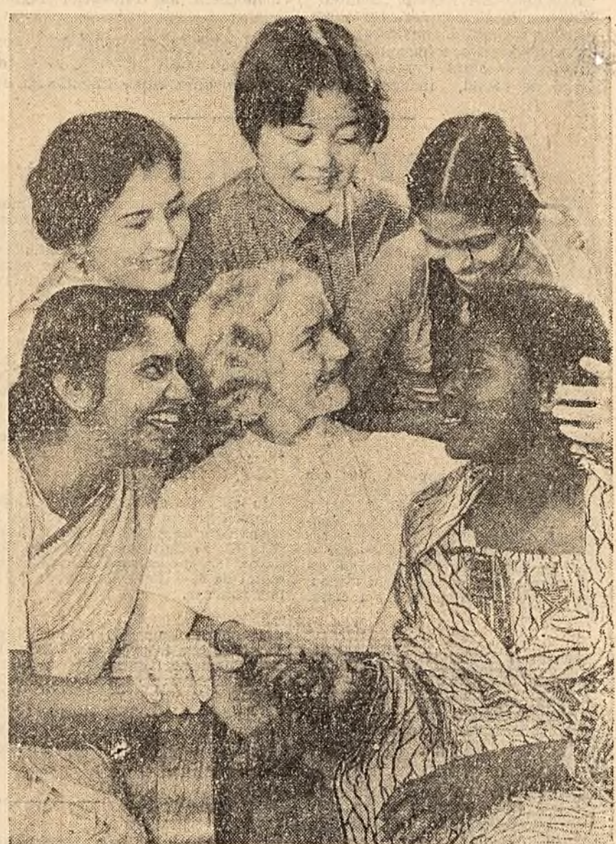
La Universitatea Prietenia Popoarelor de la Moscova. Studenți din Ceylon, U.R.S.S., Nigeria și Japonia au devenit prieteni.

Festivalul va continua pînă la 10 noiembrie.