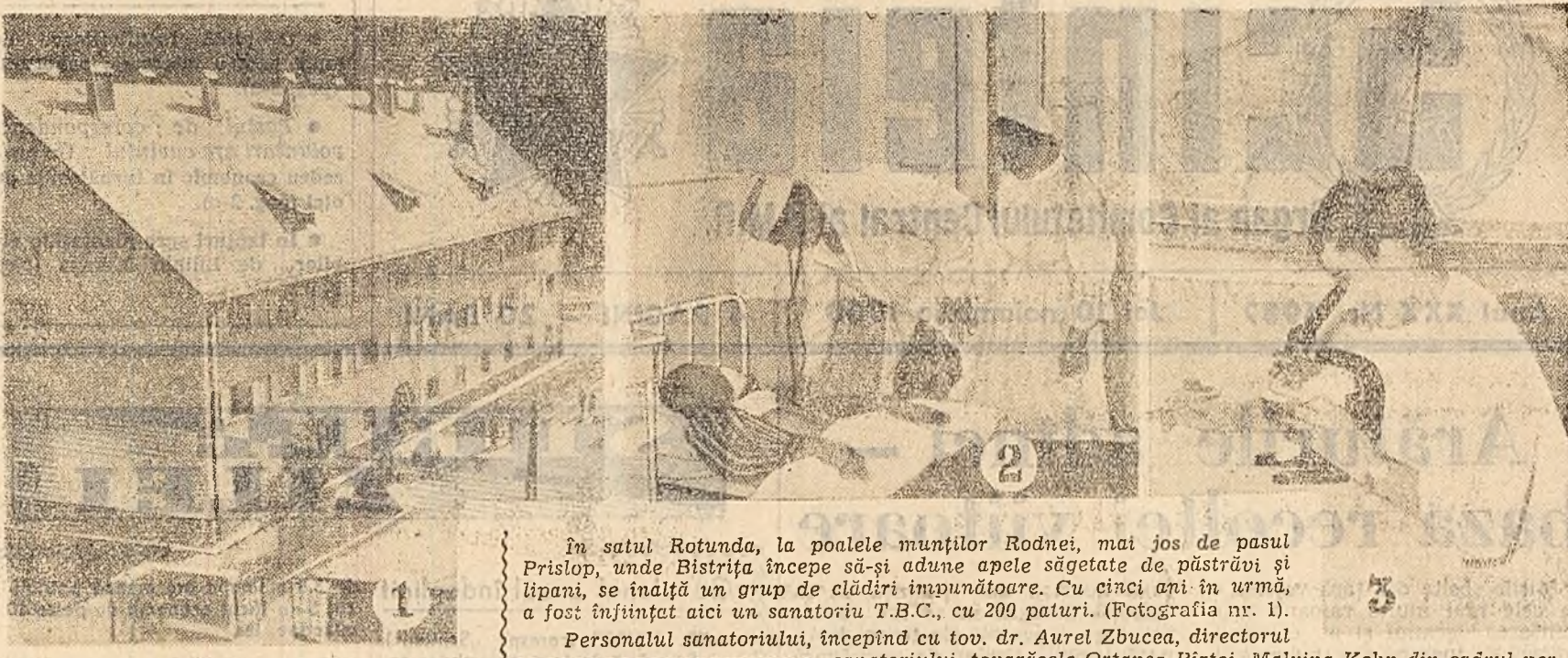
În satul Rotunda, la poalele munților Rodnei, mai jos de pasul Prislop, unde Bistrița începe să-și adune apele săgetate de păstrăvi și lipani, se înalță un grup de clădiri impunătoare...