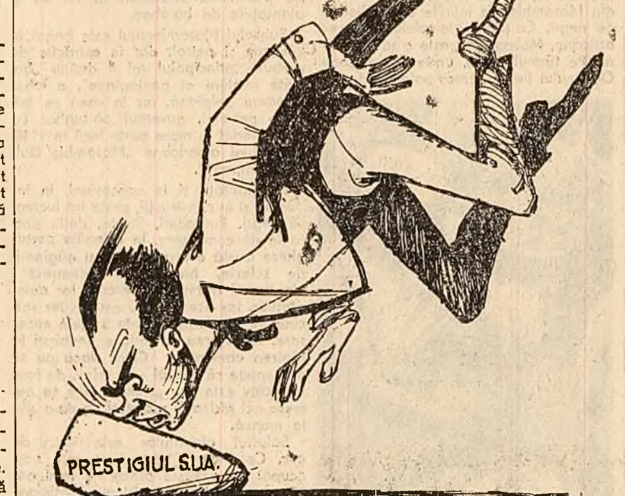
Nixon: — Aici era!... Desen de EUGEN TARU

In timpul campaniei electorale Nixon a susținut că guvernarea republicană a ridicat la mare înălțime prestigiul S.U.A.