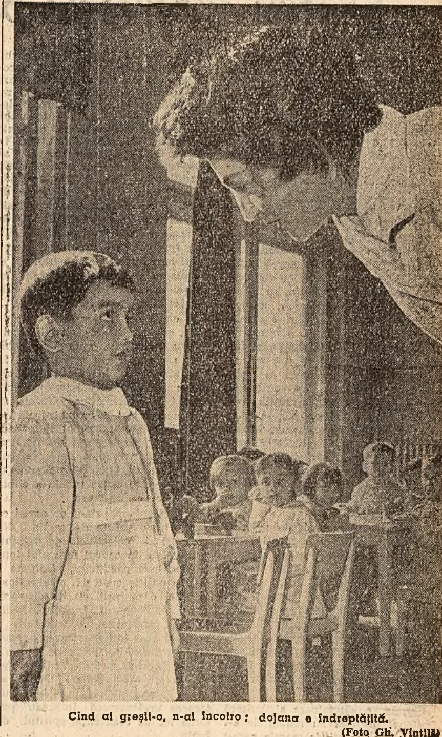
Cînd ai greșit-o, n-ai încotro; dojana e îndreptățită.