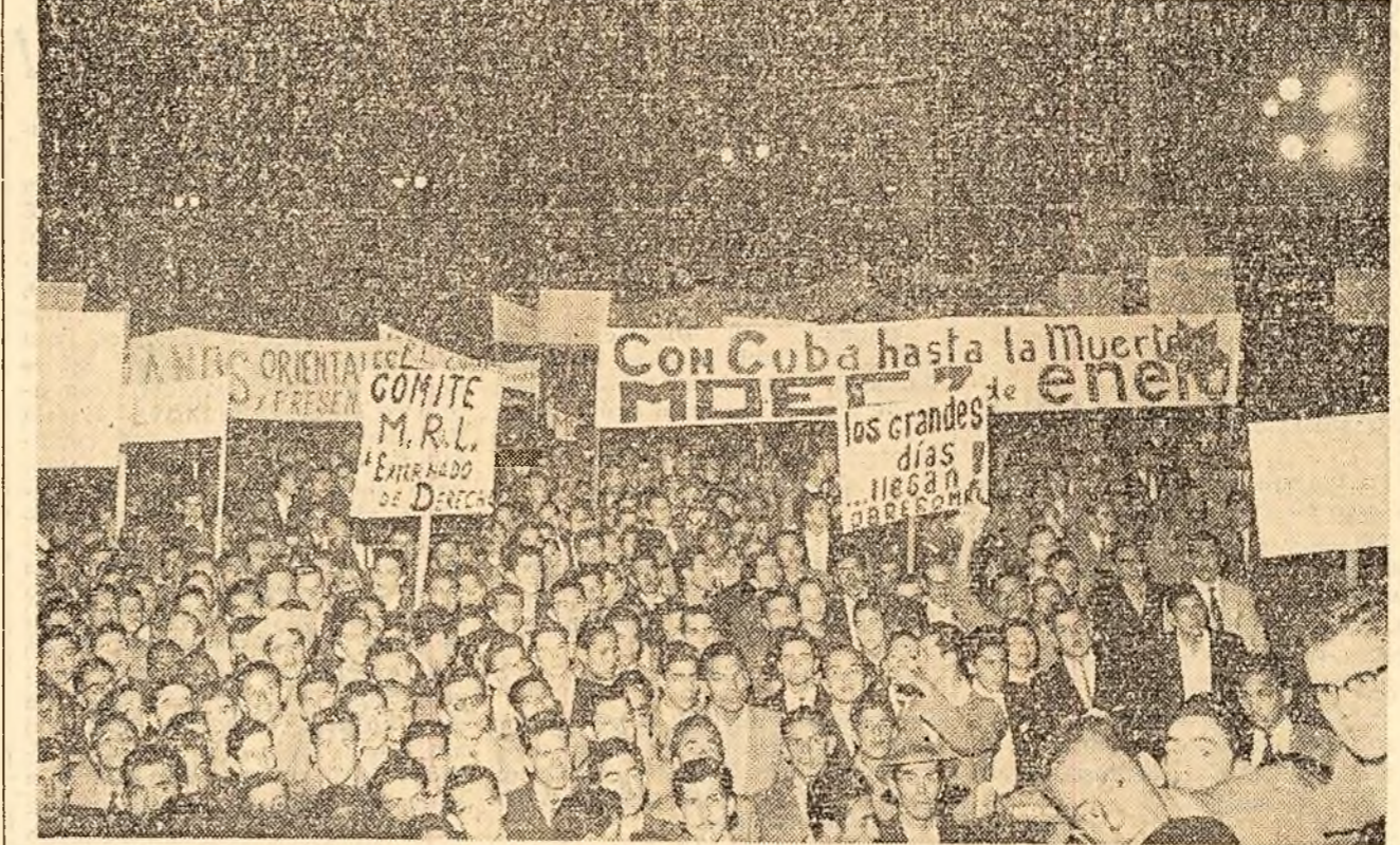
Aspect de la demonstrația din Bogota (Columbia) de solidaritate cu lupta poporului cuban.

Referindu-se la zarva propagandistică ridicată de presa imperialistă în jurul acestei călătorii asupra posibilității ca Algeria să devină comunistă, Ferhat Abbas a spus: un popor ca al nostru care luptă pentru independență, împarte țările în partizane ale poporului algerian și partizane ale imperialismului. Țările din lagărul socialist fac parte din prima categorie și de aceea considerăm că sînt prietenele noastre.