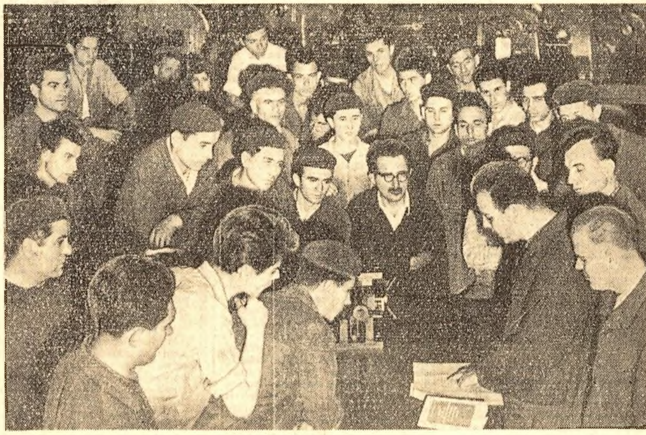
Școlarii de la uzinele „23 August” ascultă cu interes sarcinile de plan ce le revin pe anul 1961.

RĂCARI (coresp. „Scînteii”). — In mai multe rînduri, la îndemnul organizației de partid, numeroși țărani din comuna Răcari au vizitat unele gospodării colective din comunele vecine. Ei s-au convins că gospodăria colectivă asigură venituri mari membrilor ei. De pildă, la gospodăria colectivă din Ghîmpați, raionul Răcari, s-a obținut o producție de 2.500 kg. grîu la ha. și recolte mari la celelalte culturi. Ca urmare, tot mai mulți au fost aceia care înaintau cereri de înscriere in gospodăria colectivă. Duminică a avut loc inaugurarea noii gospodării colective in care au intrat 526 familii. In aceeași zi, în raionul Răcari s-au mai înființat patru noi gospodării colective. CLUJ (coresp. „Scînteii”). — Gospodăriile colective din Romînași și Petrinzel au ferme mari de vaci, oi și porci, care le aduc însemnate venituri. Totodată, realizează și producții bogate de grîu și porumb la ha. Toate aceste succese au avut o puternică influență asupra țăr-