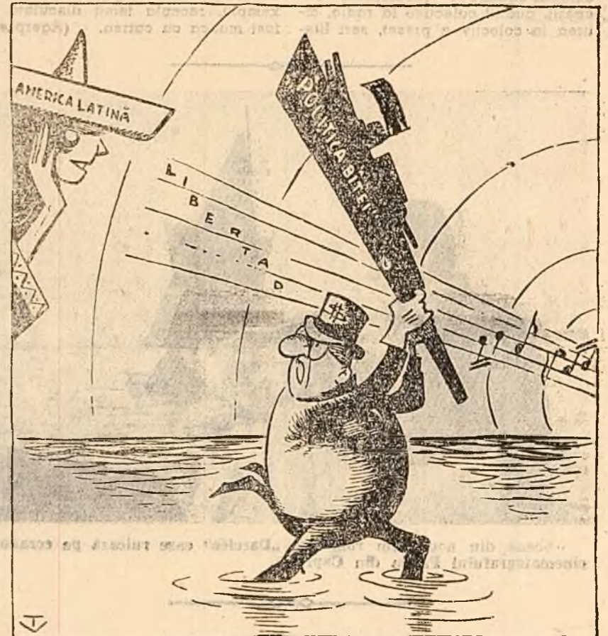
— Îți interzic, senora, să ascuți cîntece cubane!... (Desen de V. TIMOC)

În fața revoluției, imperialismul este neputincios. Trîmîndu-și forțele maritime militare în Marea Caraibilor, Statele Unite n-au făcut decît să-și știrbească și mai mult prestigiul, a arătat Castro.