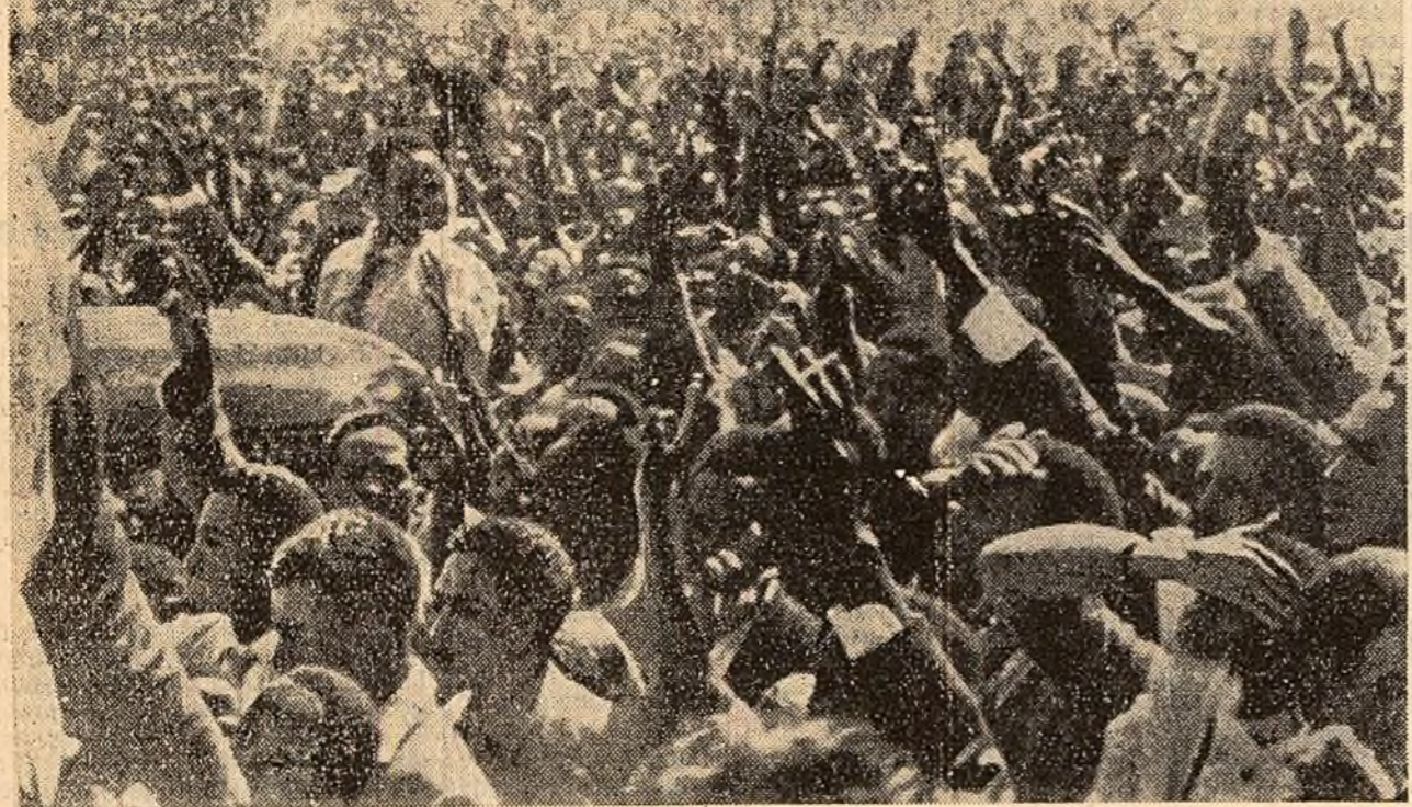
În ciuda terorii colonialiste populația din Kenya continuă lupta. Recent, la Nairobi, a avut loc un mare miting pentru eliberarea lui Jomo Kenyatta, fruntaș al mișcării de eliberare aflat în închisoare.

Căușind să salveze aparențele, James Wadsworth, șeful delegației americane la O.N.U., a convocat în grabă o conferință de presă la care a lăsat să se înțeleagă că scrisoarea ar fi opera unui „mobun excentric” și a spus că s-au dat dispoziții F.B.I.-ului să „corceteze” cazul.