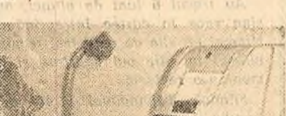
Cum este distribuit fosforul radioactiv în frunza de bumbac fotografată? Iată ce analizează ing. Nicolae Băjescu la aparatul denumit Intensimetru.

vas seminte de același fel care, în prealabil, au fost ținute un anumit timp în soluții cu izotopi radioactivi. Din 100 de seminte tratate astfel cu izotopi au încolțit 49, din cele neterminate numai 30. În plus — sînt radioactive. Această calitate a lor permite cercetătorilor să le urmărească deplasarea prin corpul plantei, precum și diversele procese vitale la care iau parte.