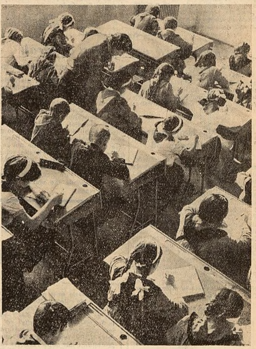
— Ne străduim cu toții să scriem frumos.