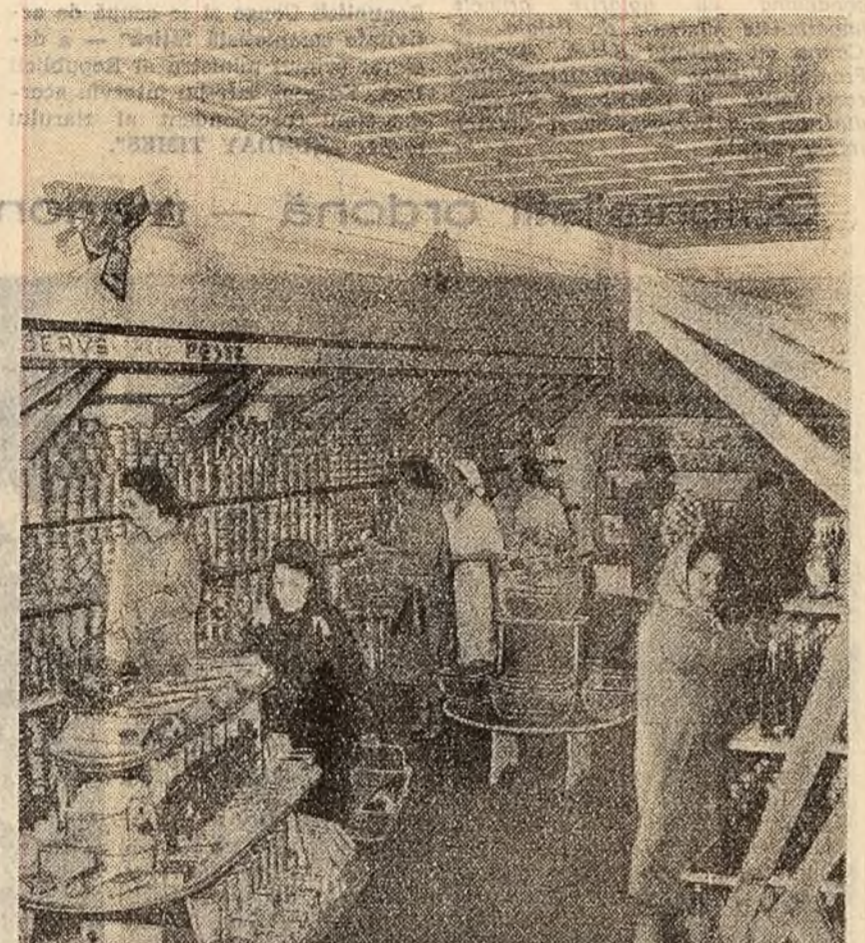
Noul magazin cu autodeservire deschis la Brașov.

conducerii unor ministere și organizații obștești, oameni de artă și cultură. Au luat parte sefi ai unor misiuni diplomatice acreditate la București și alți membri ai corpului diplomatic. Cotețul s-a desfășurat într-o atmosferă de căldă prietenească. (Agerpres)