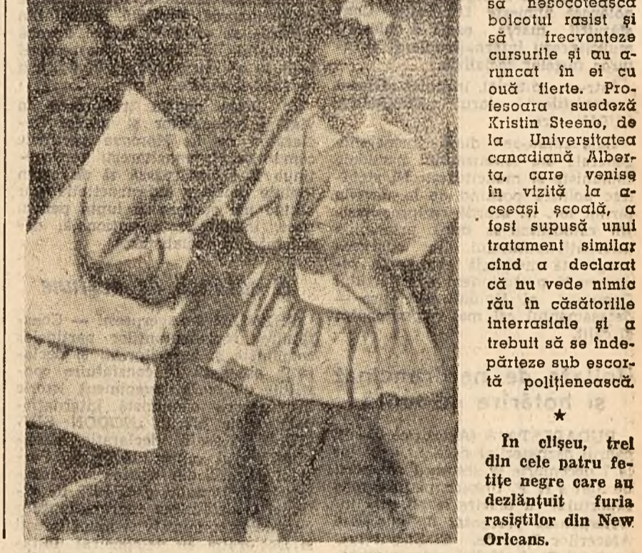
In olșeu, trei din cele patru fetițe negre care au dezlănțuit furia rasiștilor din New Orleans.