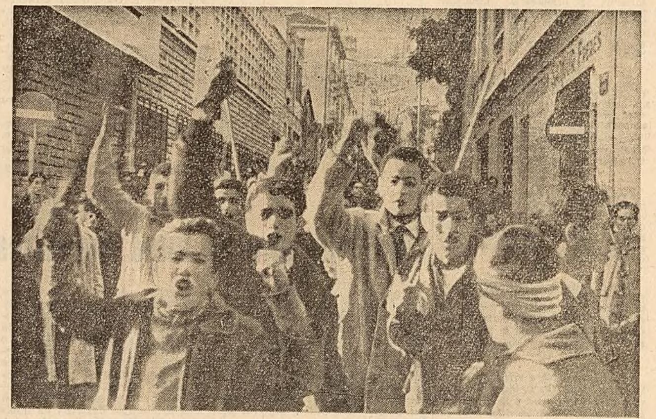
In Casbah din Alger se desfășoară în continuare puternice demonstrații ale algerienilor cerând dreptul la autodeterminare.

PARIS 15 (Agerpres). — După cum anunță ziarul „L'Humanité”, Partidul Comunist din Algeria a difuzat la 14 decembrie în Algeria un manifest în care declară că „partidul îndoliat se închină în fața victimelor evenimentelor din 14 decembrie”.