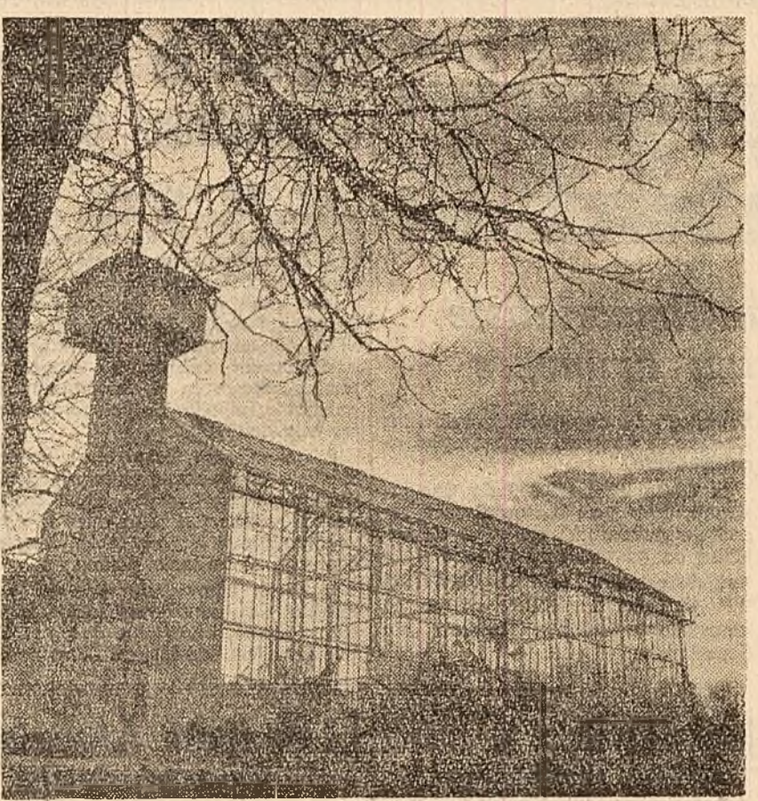
Aspect exterior al noului complex de sere din Cluj care ocupă o suprafață de 2000 mp.