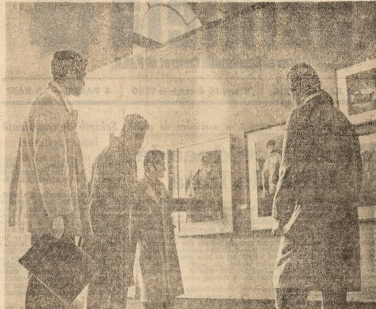
Un grup de studenți de la Institutul de artă plastică „N. Grigorescu” din Capitală vizitînd Expoziția anuală de grafică.

● Zilele trecute, în comuna Leu, raionul Craiova, a fost deschis un magazin universal. Noul magazin este bine aprovizionat cu produse cereale de țărani muncitori. (De la TOMA I. DUMITRESCU, colectivist).