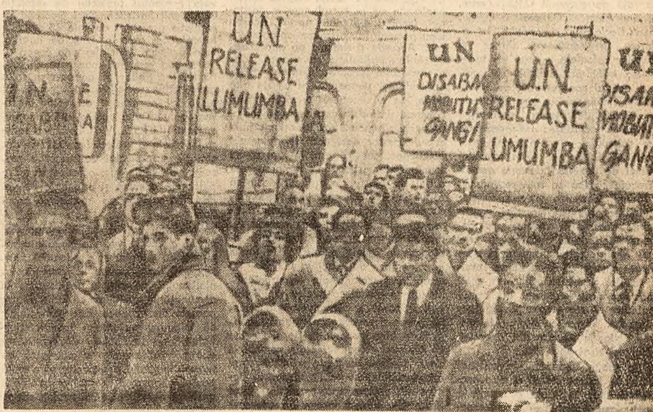
Coloană de manifestații la Londra. Participanții cer conducătorilor O.N.U. eliberarea primului ministru al Republicii Congo, P. Lumumba, și dezarmarea bandelor lui Mobutu.