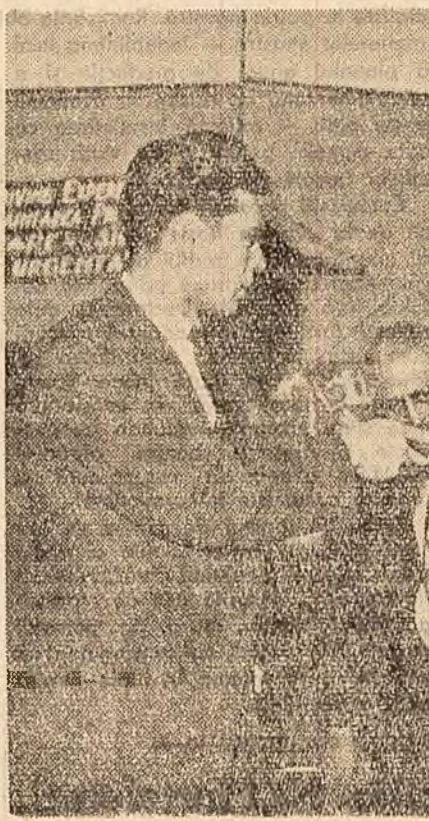
Pe scena Teatrului C.C.S. din Capitală continuă lina la celui de-al doilea Festival de teatru de amatori „I. L. Caragiale”. Ieri au dat spectacole formațiile cluburilor, cucerind de cultură și dinimelor culturale din regiunile Cluj, Constanța și Hunedoara. Publicul a aplaudat cu căldură pe artiștii hunedoreni din formația uzinei metalurgice din Cugir, raionul Orăștie, care au interpretat piesa „Mielul turbat” de Aurel Baranga. Meriță menționat

Îndeplinirea ritmică, decadă cu decadă și lună de lună a sarcinilor de plan, în fiecare întreprindere, constituie o importantă rezervă a industriei noastre socialiste.