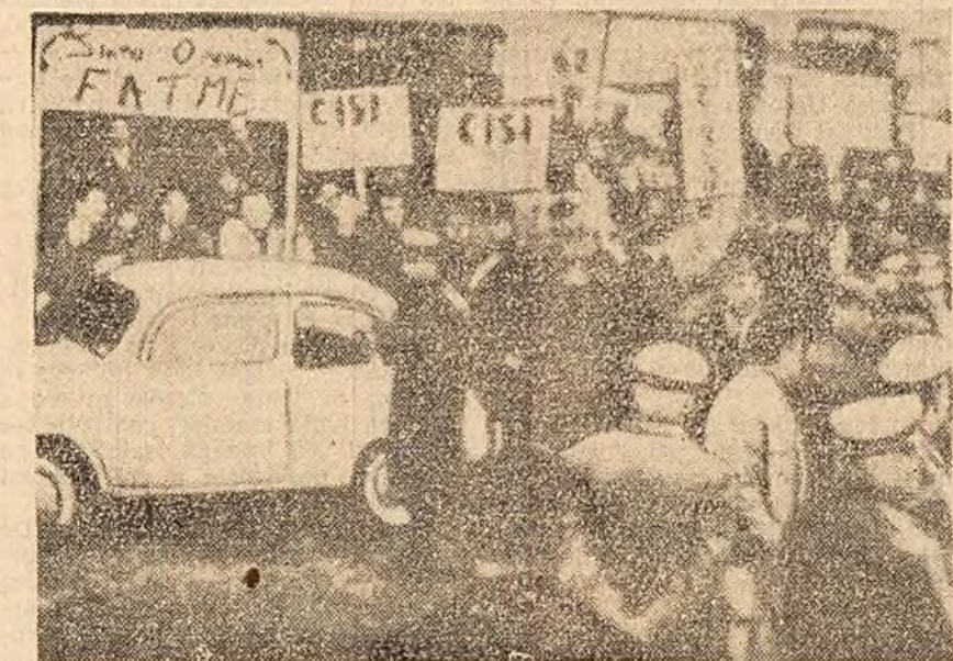
ROMA. Coloanele muncitorilor greviști de la complexul electro-mecanic Fatme au parcurs cîțiva kilometri pe străzile orașului pentru a ajunge in Piața Venetia unde se află sediul Confederației Industriștilor Italiani, pîzîți de forțe ale poliției. In fotografie: Manifestanții in piața Venetia.

OTTAWA 28 (Agerpres). — La 27 decembrie Biroul canadian de sta-