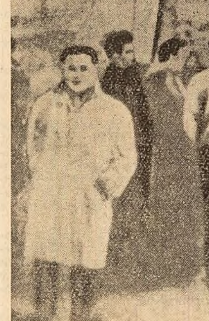
In orașul belgian Charleroi, in ciuda intervenției detașamentelor polițienești, un grup de muncitori opresc un tramvai condus de spărgătorii de grevă.

ADDIS-ABEBA 28 (Agerpres). — Agenția Associated Press a transmis o relatare a corespondentului său din Asmara (Etiopia) ca privire la activitatea centrului american de radio-retransmisie din acest oraș, care este de fapt un centru de spionaj al S.U.A. pe continentul african. Acest centru este deservit de militari americani. La Asmara trăiesc in total 2.500 de americani.