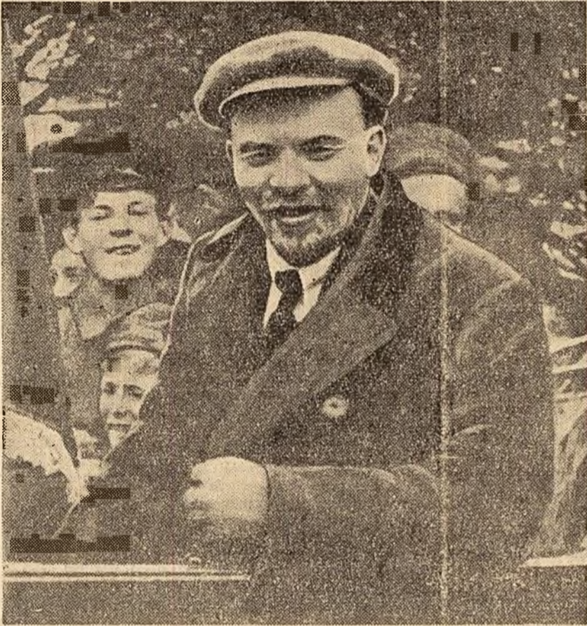
V. I. Lenin in vizita la muncitorii de la castelul de apă din Rublevo. 1 Mai, 1919.