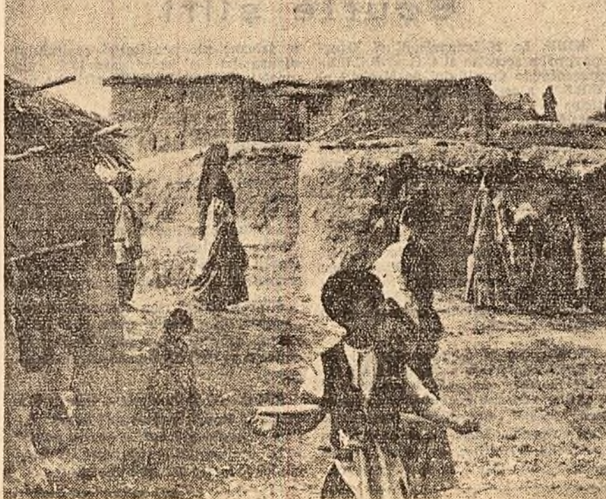
Aspect caracteristic al unui sat iranian.

„Satul iranian — conchid autorii — este un lagăr de muncă ce aparține unui singur om”.