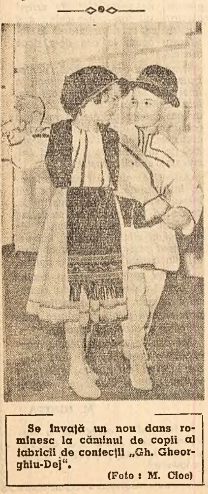
Se invata un nou dans rominesc la caminul de copii al fabricii de confecții „Gh. Gheorghiu-Dej”.