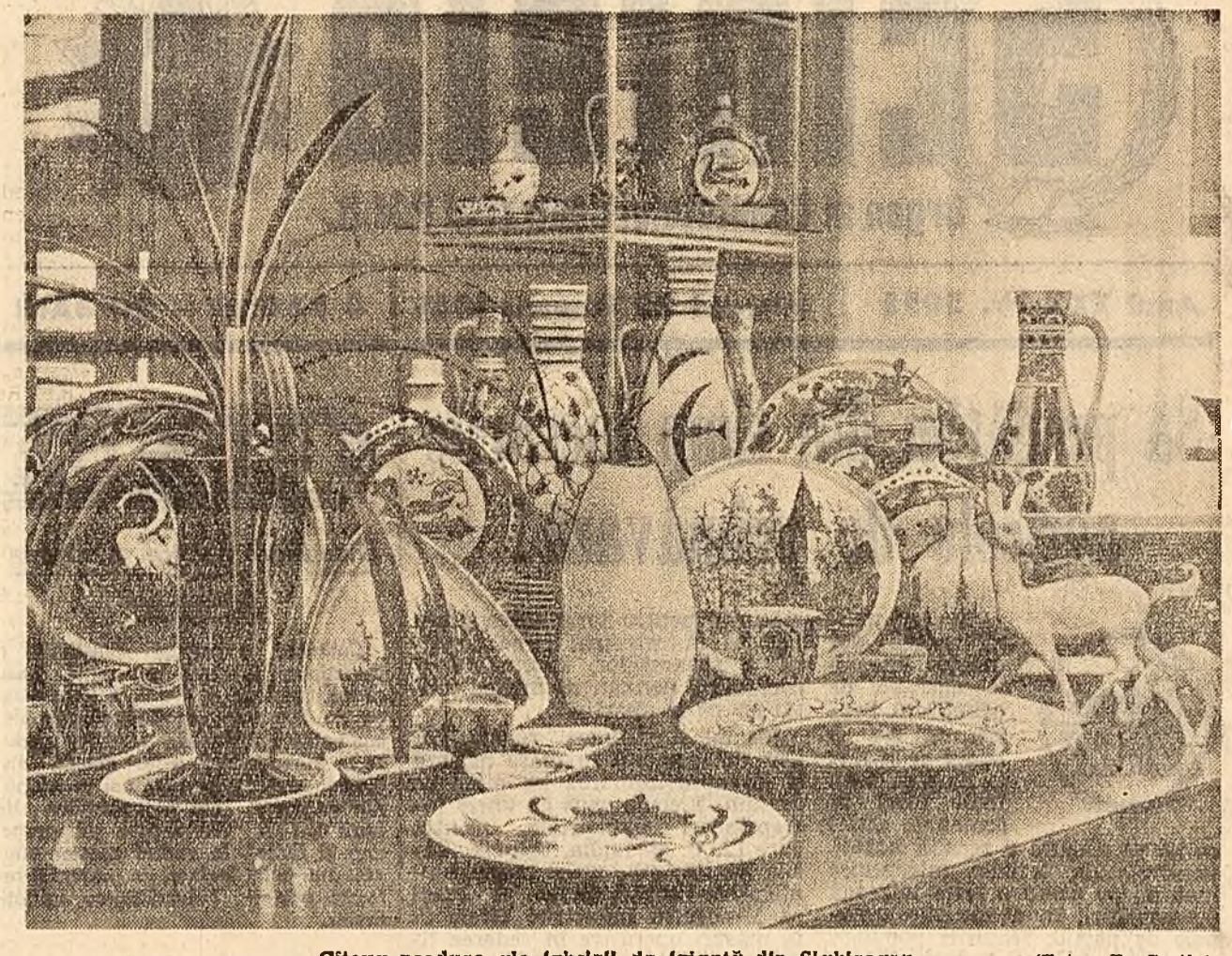
Citeva produse ale fabricii de faianță din Sighişoara.

Este valoroasă inițiativa Uniunii regionale a cooperativei de consum Ploiești de a organiza magazine cu autodeservire. Ele nu se dovedesc însă întotdeauna destul de eficace. Iată un caz. În centrul comunei Po-