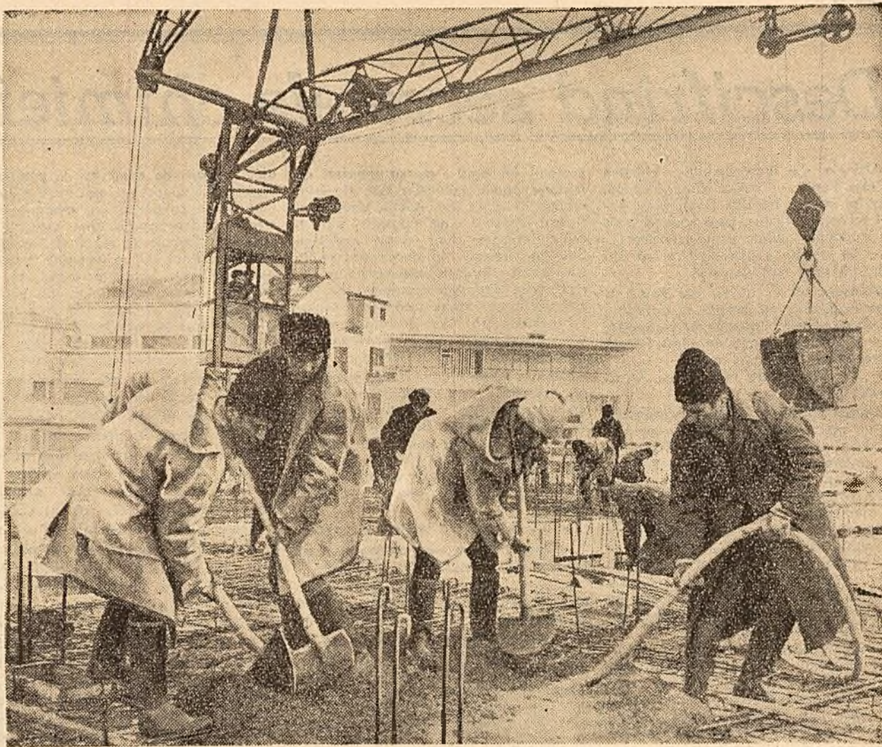
Cu toate că termometru a coborît sub zero grade, la blocul nr. 15, dintre străzile Știrbei Vodă—Doctor Sion din Capitală, folosindu-se metode înalțate, se lucrează din plin la turnarea ultimului planșeu. Zilnic se toarnă 40 m.c. beton. În fotografie: Cîțiva membri ai brigăzii de betonisti conduse de tov. Ion Burcea care lucrează aici.