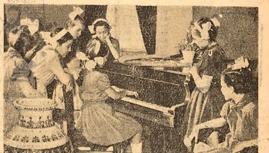
O după-amiază plăcută la Casa de copii „A. S. Makarenko” din Capitală.

ar trebui făcută ocrotirea socială”. Afilăm astfel că numul o mică parte din — citim — „sutele, mii și zecile de mii de copii lipsiți de orice sprijin și care umblă goi, neîmbrăcați și desculți” sînt cuprinși în orfelinate, iar acestea, cite sînt, „se află într-o stare de mizerie jalnică și inumană”. Statul cunoscutului omeni de afaceri și mari cercetător le acorda o subvenție lu-