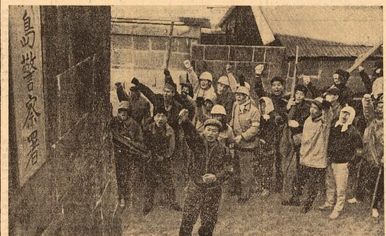
Locuitorii micilor insule NII-JIMA (Japonia) luptă împotriva construirii de baze militare pe această insulă.

aproximativ 20 de oameni. Cablurile electrice au fost rupte. În legătură cu acest accident agenția France Presse se întreabă pentru ce a fost menținut pînă acum acest munte de zgură care pune în pericol în orice moment viața locuitorilor satului și nu a fost folosită pentru aruncarea rezidurilor mina părăsită „Quatre Jean” din apropiere.