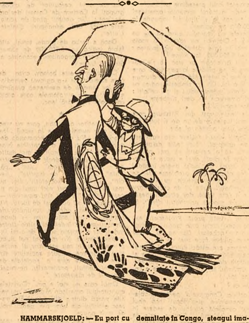
HAMMARSKJÖLD: — Eu pot cu demnitate în Congo, steagul încalcat al O.N.U.-ului 1 (Desen de EUGEN IACU)

Front național de eliberare. Înființarea acestui front, se spune într-un comunicat al Agenției de presă a eliberării, creată pe lângă Frontul național, reprezintă o nouă etapă în lupta poporului vietnamez împotriva inroitorilor străini și a trădătorilor din Vietnamul de sud.