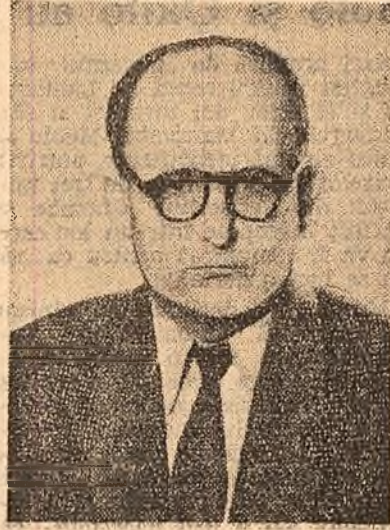
ALEXANDRU BOȘCA profesor universitar, profesor al Universității Babeș-Bolyai, candidat în circumscripția electorală nr. 19 pentru alegerile de deputați în sfatul popular regional