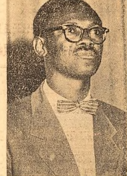
Patrice Lumumba s-a născut în 1925. El făcea parte din tribul Batetela. După ce a urmat o școală de misionari, Lumumba a devenit funcționar la poșta, apoi a lucrat într-o fabrică de bere, de unde a fost concediat pentru activitatea socială intensă. În decembrie 1958, Lumumba a înființat partidul „Mișcarea națională congoleză” care a încercat să realizeze „său eliberarea țării de sub jugul colonialiștilor belgieni”. În octombrie 1959, după ce autoritățile belgiene au îndăruit demonstrațiile anticolonialiste de la Stanleyville, el a fost condamnat la închisoare. Dar, aproape un an mai târziu, autoritățile coloniale belgiene au fost nevoite, sub presiunea mișcărilor populare, să-l elibereze. Lumumba a plecat imediat la Bruxelles pentru a lua parte, în calitate de reprezentant al poporului congolez, la tratativele care au avut loc în legătură cu viitorul Congoiului. La 30 iunie 1960 a fost proclamată independența Republicii Congo. Patrice Lumumba a devenit primul ministru al noii republici. Alarmat de politica independentă și antiimperialistă promovată de guvernul Lumumba, colonialiștii belgieni și aliații lor din cadrul blocului N.A.T.O., cu ajutorul marionetelor lor, Mobutu, Kasavubu și Chombe, au înălțat guvernul legal, instaurând domnia terorii și a asasinatelor. Patrice Lumumba a fost arestat de bandele lui Mobutu, tratat în mod bestial și încarcerat la închisoarea din Thyssville. După îndăruită răscoală garnizoanei din Thyssville, el a fost transportat în secret la Elisabethville și dat pe mina călăilor lui Chombe. Aceasta a însemnat de fapt pregătirea asasinării lui Lumumba. După ce au înscenat masacrarea unei „evadări”, autoritățile din Katanga au anunțat vestea asasinării eroicului fiu al poporului congolez, Patrice Lumumba.

dolari promisă de „guvernul” katanghez pentru capul lui Lumumba și al celor doi tovarășii ai săi. Cadavrele lui Lumumba, Mpolo și Okito au fost identificate, potrivit spuselor lui Munongo, de trei miniștri din „guvernul” Chombe și au fost îngropate într-un loc care nu va fi comunicat pentru că „să nu se facă pelerinaj”. Munongo a declarat cu cinism că pentru el „moartea lui Lumumba n-a fost o surpriză”. Acest călău care, probabil, a condus personal răfuiala cu eroul național al poporului congolez, a confirmat astfel că se poate de sincer că întreaga versiune despre „evadarea” lui Lumumba și a tovarășilor săi a fost născocită cu scopul de a camufla exterminarea lui Lumumba.