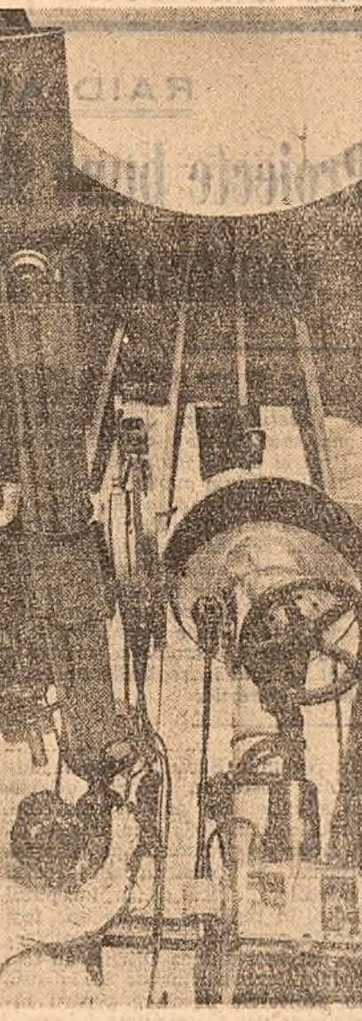
La Observatorul Astronomic din Capitală. Următoarele pregătiri în vederea studiului eclipsei de Soare de la 15 februarie.

Încăodată se dovedește puterea de cunoaștere a minții omenești, capacitatea ei de a dezvălui și explica cu ajutorul științei, rînd pe rînd, tainele naturii înlăturînd întunecul neștiinței și obscurantismului. O nouă și minunată cunoaștere a științei și tehnicii care însușii o încredere sporită în forța creatoare a omului o reprezintă stația interplanetară sovietică lansată spre planeta Venus.