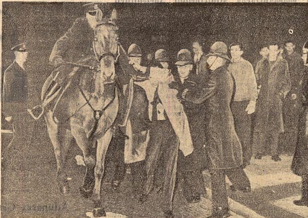
In fața ambasadelor belgiene din Londra s-a desfășurat o demonstrație de protest împotriva asasinării lui Patrice Lumumba și a tovarășilor săi de luptă. În fotografie: Poliția atacă pe demonstrații.

FRANKFURT PE MAIN. La 19 februarie sule de tineri și studenți au participat la demonstrația de protest care a avut loc la Frankfurt pe Main împotriva asasinării primului-ministru congolez Patrice Lumumba.