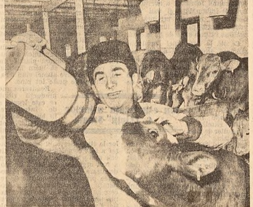
Dezvoltarea sectorului zootehnic a necesitat construirea de adăposturi pentru animale. Fotografia de sus reprezintă o parte din construcțiile zootehnice...