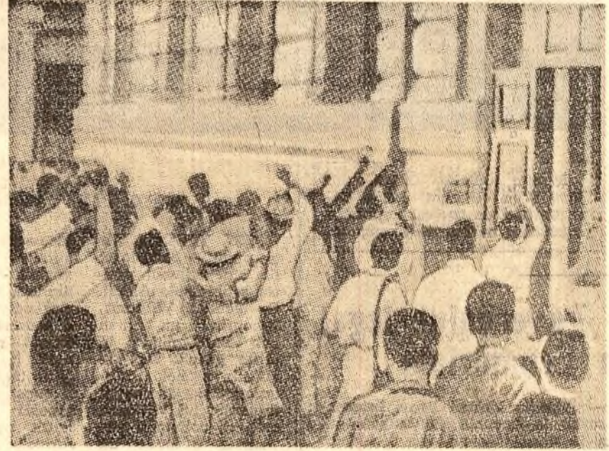
Demonstrație de protest în fața ambasadelor americane din Rangoon împotriva furnizării de arme și muniții purtînd inscripția „Made in U.S.A.” trupelor clancășiste acuzate în nordul Birmaniei.

În orașul Borazjan, muncitorii au organizat o grevă în semn de protest împotriva neregurilor electorale. Pe străzile Teheranului — subliniază revista — au avut loc bătăli între poliție și demonstrații anti-guvernamentale. Ele s-au soldat cu 18 răniți și 80 persoane arestate. Polițiștii au aruncat grenade cu gaze lacrimogene într-un grup care stăpînea la un colț de stradă și abia mai tirziu au aflat că oamenii... așteptau autobuzul. A fost clar — scrie „Time” — că noile alegeri s-au desfășurat în celeași condiții de șantaj și corupție ca și cele din august anul trecut. Un partid s-a arătat însă puternic, deși nu a obținut nici un mandat. Frontul Național a ordonat ca ele să fie boicotate. Din cei 600.000 de alegători din capitala Teheran, numai 65.000 s-au prezentat la urne.