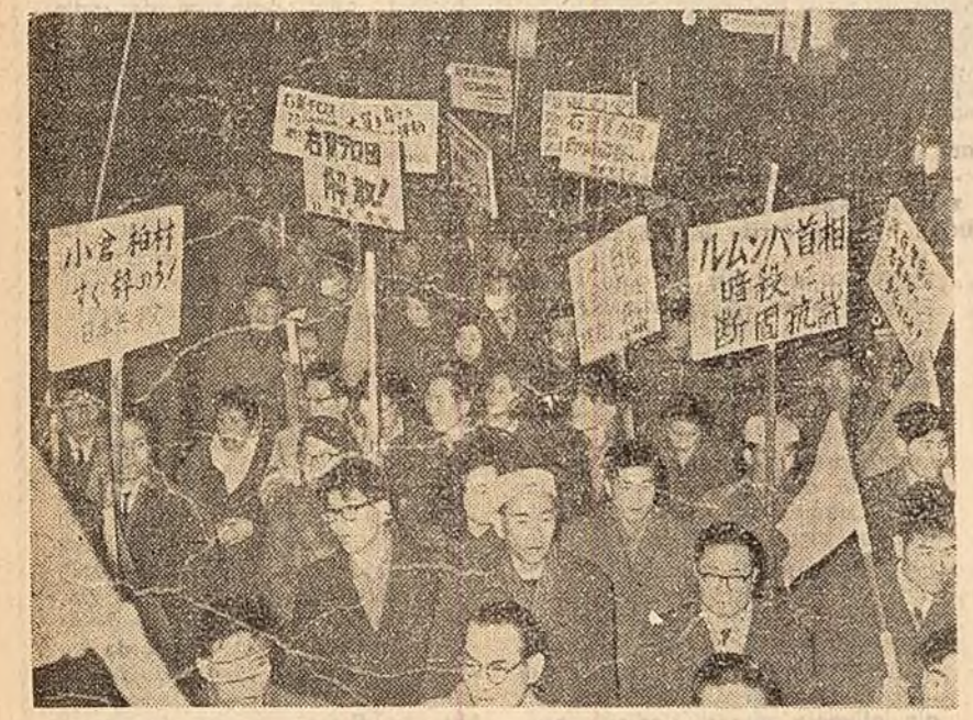
Zilnic, în fața ambasadelor Belgiei la Tokio au loc demonstrații împotriva asasinării comise de colonialiștii în Congo.