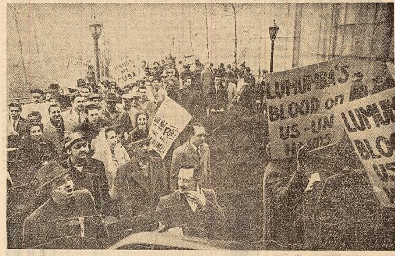
In fața sediului O.N.U. din New York a avut loc o demonstrație de protest împotriva asasinării lui Patrice Lumumba.