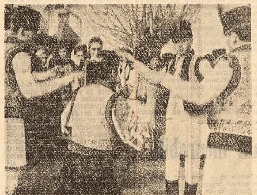
Zi de sărbătoare și în comuna Ilșești, raionul Gura Humorului. Tineri, îmbrăcați în frumusețe în costume naționale, s-au prins în horă.