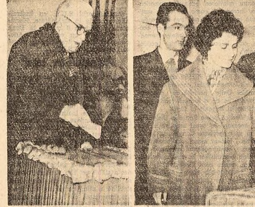
Iași. Oameni de știință, profe sori, studenți, alături de toți oamenii muncii, și-au dat votul pentru dezvoltarea continuă a științei și culturii, pentru înflorirea patriei noastre.