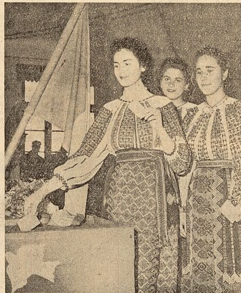
Tinere din satul Borșești, raionul Pitești, la vot.