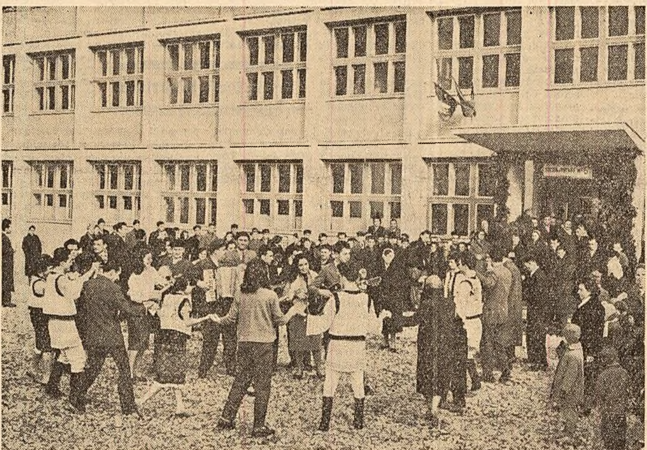
Ca și în toată țara, jocul și vola bună au domnit și printre muncitorii uzinelor „Steagul Roșu” din Brașov. Aspect de la secția de votare nr. 8 din cartierul „Steagul Roșu”.