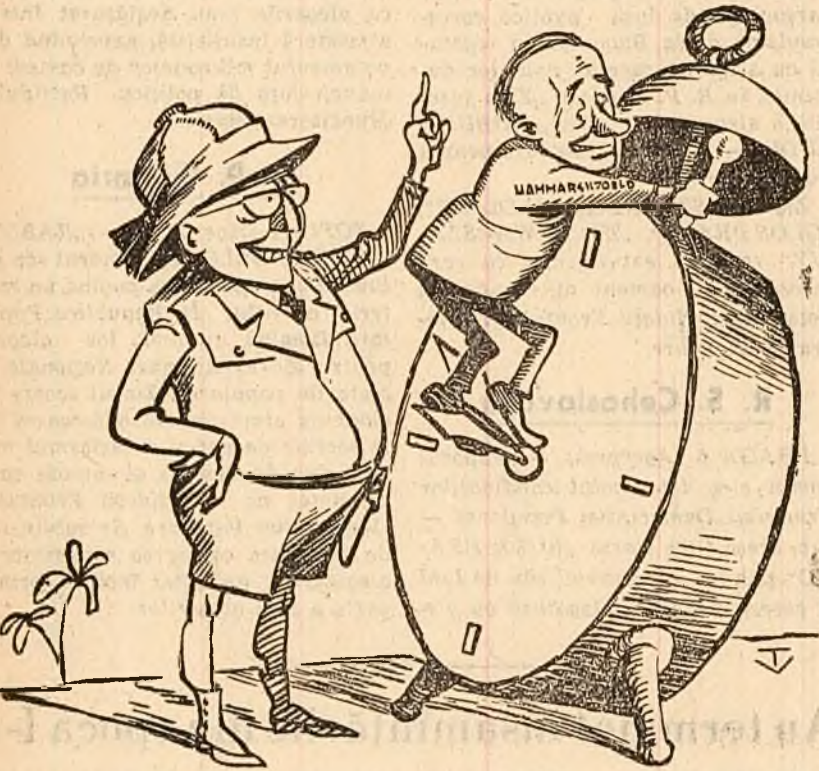
— Bravo, Dag! Ține-te bine, ca să nu-mi sune ceasul! (Desen de V. TIMOC)

Hammarškoeldă tărgănează aplicarea ultimei rezoluții a Consiliului de Securitate pentru a câștiga timp în favoarea stăpînitorilor săi.