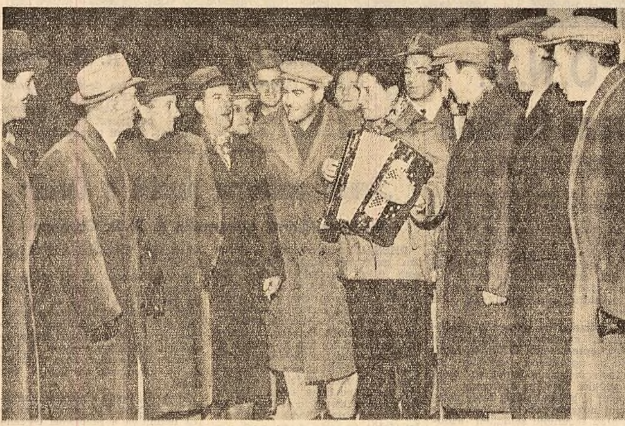
Un grup de muncitori de la fabrica de mobilă „23 August” din Tg. Mureș în fața secției de votare nr. 15.