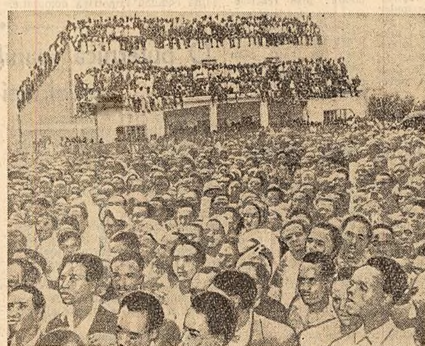
Miting de protest al populației din Kenya împotriva deținerii lui Jomo Kenyatta, conducător al mișcării de eliberare națională, de către colonialiștii englezi.

NAIROBI 6 (Agerpres). — Partidul Uniunea Națională Africană din Kenya, care a obținut la ultimele alegeri pentru Consiliul legislativ majoritatea voturilor, a hotărât să