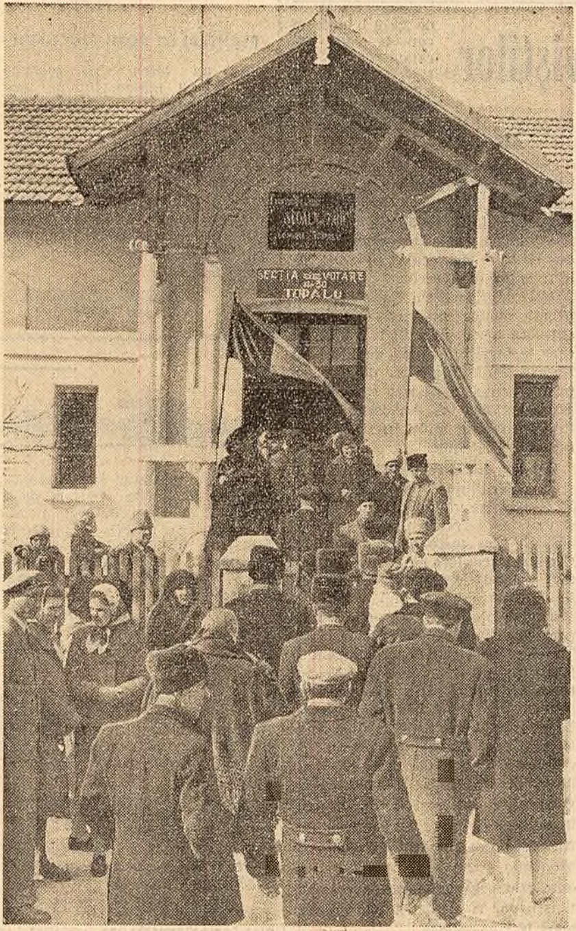
Colectiviiștii din Topalu, regiunea Dobrogea, s-au îndreptat încă în primele ore ale zilei de 5 martie spre secția de votare.