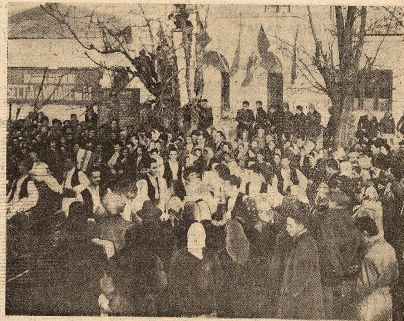
De ziua alegerilor, în fața unei secții de votare din Capitală.

Votul unanim și entuziast acordat candidaților Frontului Democrației Populare constituie o strălucită manifestare a înaltei conștiințe cetățenești a maselor. El reprezintă o minunată victorie care va insufla un nou și puternic avînt luptei poporului pentru înflorirea patriei socialiste. Strîns unit în jurul partidului și guvernului, poporul nostru pășeste spre noi realizări în dezvoltarea economică și culturală, pentru ridicarea mai departe a nivelului de trai al oamenilor muncii, pentru desăvîrșirea construcției socialiste în scumpă noastră patrie.