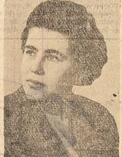
FLORICA BLAGA președinta Comitetului femeilor din regiunea Crișana, deputată în Marea Adunare Națională.