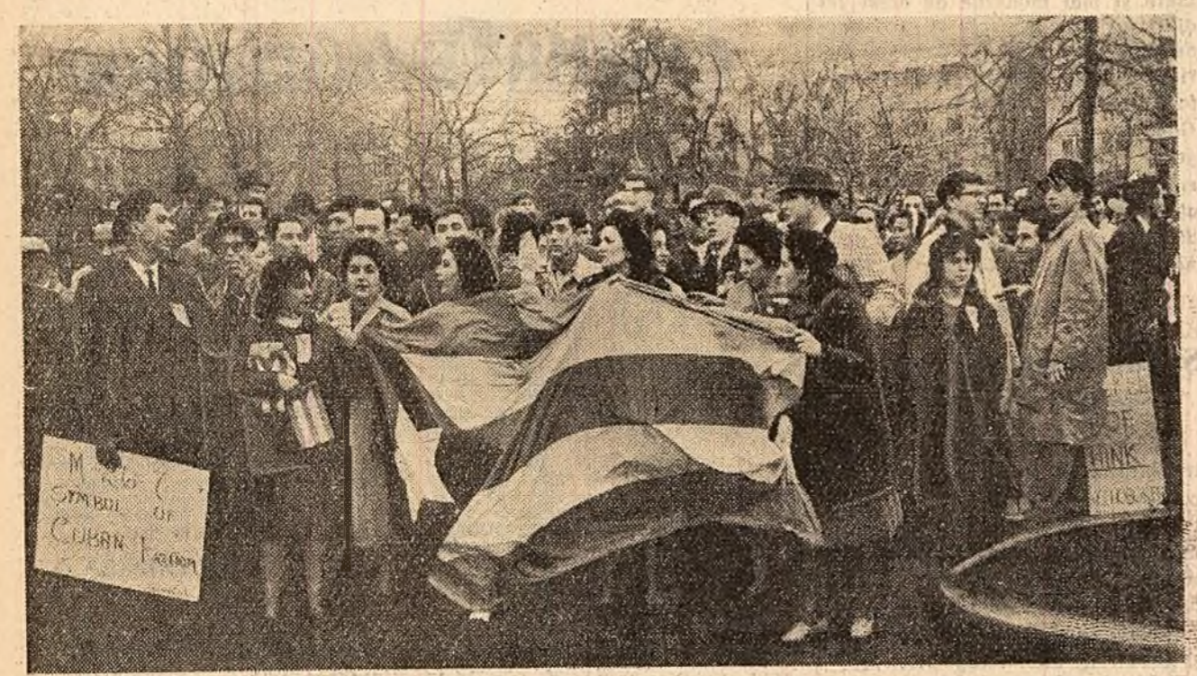
Patrioți exilați din Paraguay și Republica Dominicană au organizat o demonstrație pe străzile Washingtonului în sprijinul revoluției cubane. În fotografie: un grup de manifestați desfășoară Drapelul Cubei.

După ce Adunarea Generală a păstrat un moment de reculegere în memoria regelui Marocului, Mohamad al V-lea, Kwame Nkrumah, președintele Ghanai, a rostit o cuvîntare.