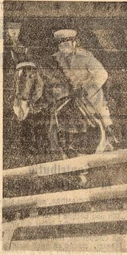
Mamejul din Calea Plevnei a găzduit ieri dimineață primele întreceri din acest sezon ale cătăreților noștri frunțosi. Fotoreporterul nostru a surprins o săritură în proba de obstacole mijlocie.

„Un drop-gol, al lui Peniu, — trims cu adresă chiar în primele minute — face ca echipa C.C.A. să ia