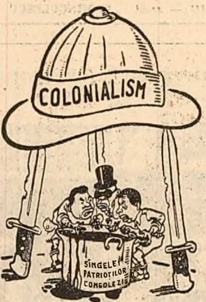
(Desen de G. Onanov din ziarul „Komsomolskaia Pravda”)

După cum relatează corespondentul agenției Prensa Latina, în declarația sindicatului marinarilor din flota comercială, dată publicității, la 10 martie în orașul Panama, se subliniază că acest asasinat a constituit o răzbunare întrucît Castillo apăruse interesele marinarilor, precum și o încercare de a întîmpani atît pe ceilalți membri ai echipajului cit și pe marinarii altor nave aparținînd acestei societăți.