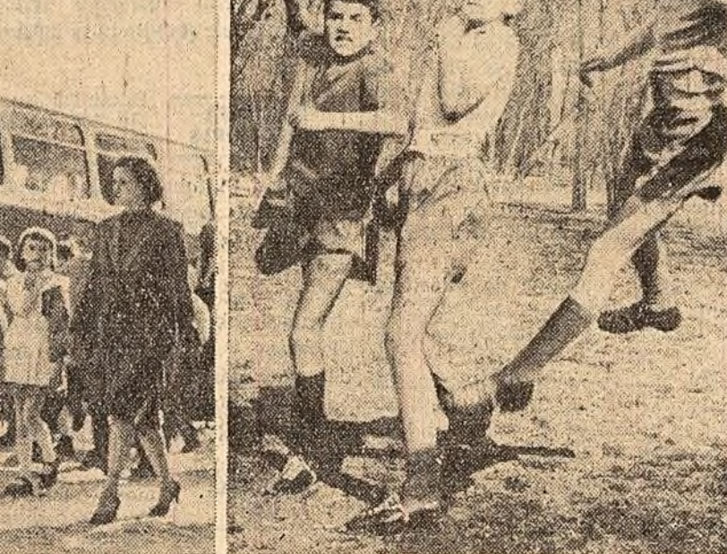
leșten! Duel aerian... Fază de la un disputat meci al tinerilor fotbalști.