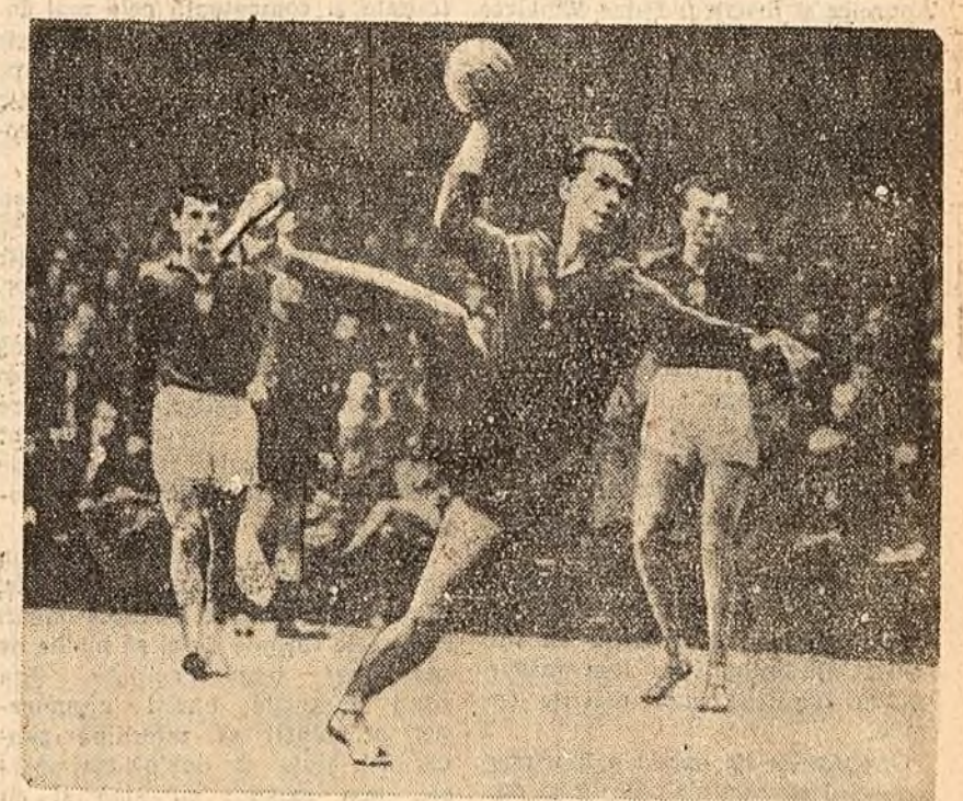
Fază din meciul de la Dortmund

Un succes de mare răsunet a obținut ieri seară la Dortmund (R.F. Germană) echipa de handbal în 7 a țării noastre. Disputându-și finala campionatului mondial cu reprezentativa R. S.