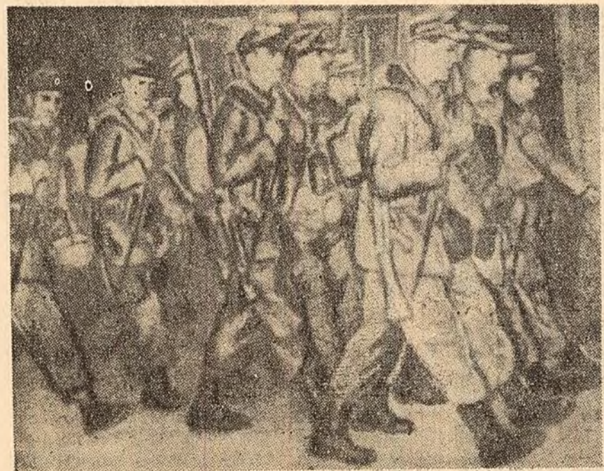
Pe străzile Mourmelonului răsună din nou cadența cizmilor Bundeswehrului.

Manevrele trupelor vest-germane în Franța vor începe luni 13 martie și vor continua pînă la 25 martie. Populația din orașele franceze situate în departamentele nordice ale țării, prin care au trecut și unde s-au amplasat soldații vest-germani, protestează cu energie împotriva cîrărilor guvernului francez cu clica militaristă de la Bonn, cerînd retragerea imediată a trupelor vest-germane de pe teritoriul Franței.