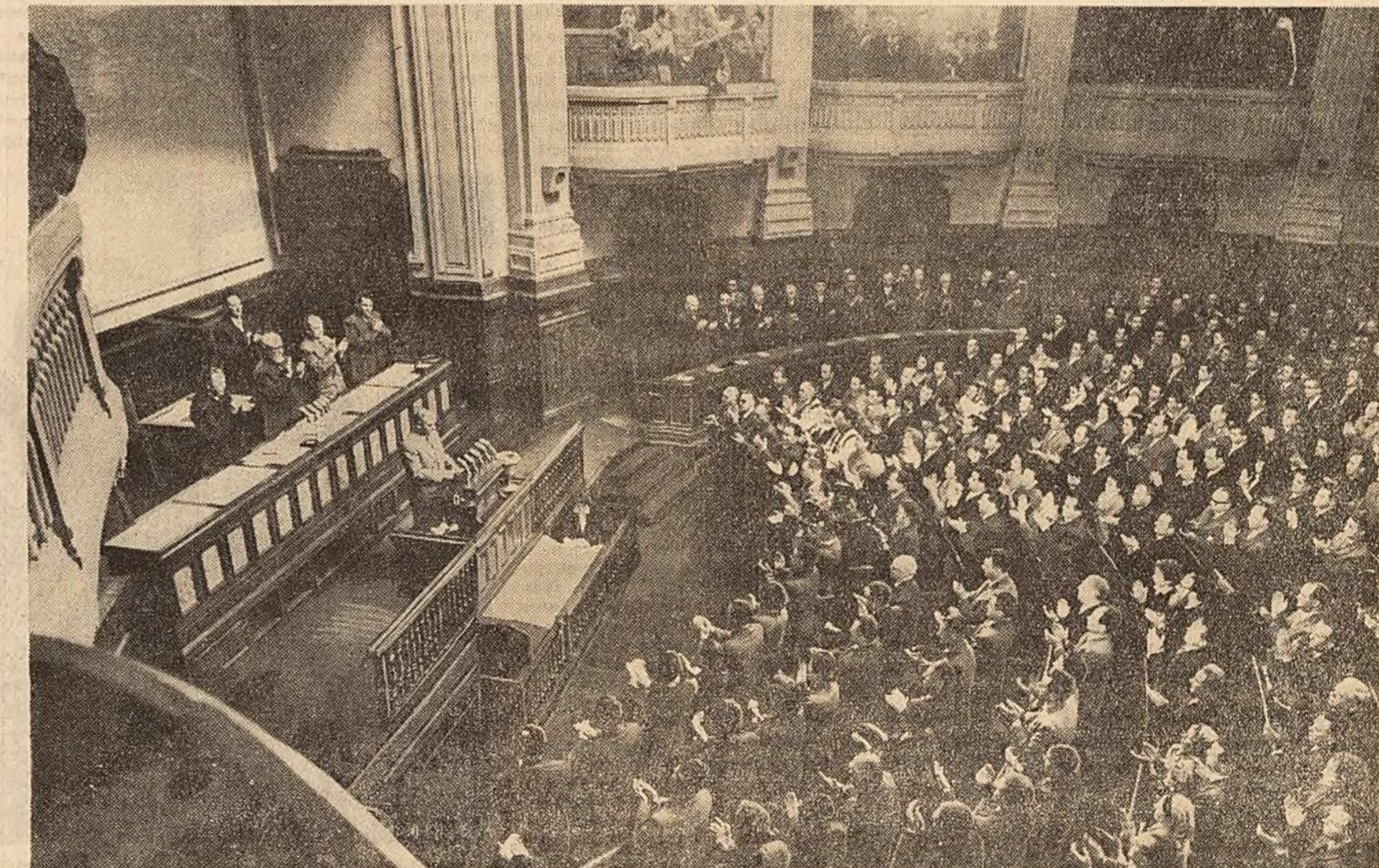
Un aspect din sala de ședințe a Marii Adunări Naționale: deputații aplaudă îndelung cuvîntarea tovarășului Gheorghe Gheorghiu-Dej.