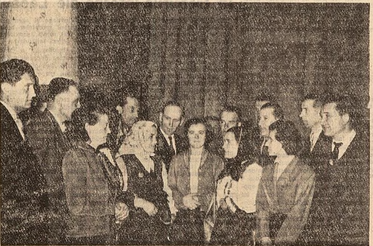
Un grup de deputați în timpul unei pauze.