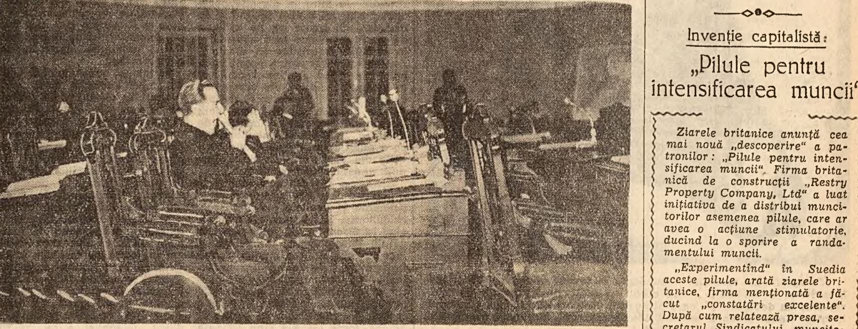
Sedînța scaunelor goale — așa s-ar putea numi șesenta reuniune a senatului Columbiei pentru discu-tarea problemei ruperii relațiilor cu Cuba. Auditoriul e mai puțin decît modest ca număr. Majoritatea sena-torilor lipsesc în mod demonstrativ. Puținii care asis-tă la această dezbatere împusă de Departamentul de stat al S.U.A. fac față cu greu, după cum se vede din fotografie, indiferenței și plictiseli.

MOSCOVA 24 (Agerpres). — Vi-neri s-a desfășurat cea de-a 5-a partidă a meciului revanșă pentru titlul mondial de șah. Intr-o varian-tă a apărării Nimzoici, Botvinnik a ales o continuare nouă, punînd probleme dificile partenerului său. După ce a gîndit 50 de minute la mutarea a 13-a, campionul lumii a propus revizua dar Botvinnik nu a acceptat. În ultima oră de joc, Tal s-a aflat în mare criză de timp. La mutarea 35, Botvinnik a reușit să cîștige un pion, pe care-l păstrează în finalul complicat de tîrnuri și cai. Partida s-a întrerupt la muta-rea 41 în următoarea poziție: Alb (Botvinnik) Re2, Ta2, Td2, Cc2; pioni la a4, b5, e5, f2, g2, h3; Negru (Tal) Rf7, Tc3, Tc4, Ce5; pioni la a5, b6, f6, g7, h7. Tal a dat mutarea 41 în plic. Partida va fi continuată astăzi. Reamintim că scorul meciului este de 2½-1½ în favoarea lui Botvinnik.