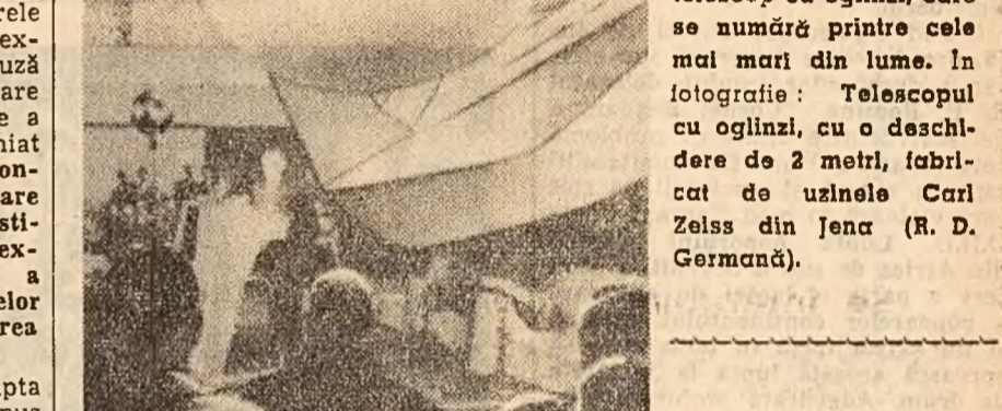
La observatorul „Karl Schwarzschild” al Academiei Germane de Științe a fost instalat un telescop cu oglinzi, care se numără printre cele mai mari din lume. În fotografie: Telescopul cu oglinzi, cu o deschidere de 2 metri, fabricat de uzinele Carl Zeiss din Jena (R. D. Germană).

În intervalul de un an ce s-a scurs de la cea de-a doua conferință a popoarelor Africii, care a avut loc la Tunis, pe acest continent s-au produs mari schimbări; acestea, după cum a declarat unul din co-res-pondenții agenției TASS Abdulaye Diallo, secretar general al Secreta-riatului permanent al Conferinței popoarelor din întreaga Africă, pun o amprentă pe cea de-a treia con-ferință. Datorită mișcărilor de elibe-rare națională care ia o extindere tot mai mare în Africa și sprijinu-tă de luptele popoarelor coloni-ale și dependente din partea tu-lor forțelor progresiste ale ome-nirii, Adunarea Generală a O.N.U. a adoptat Declarația cu privire la acordarea independenței țărilor și