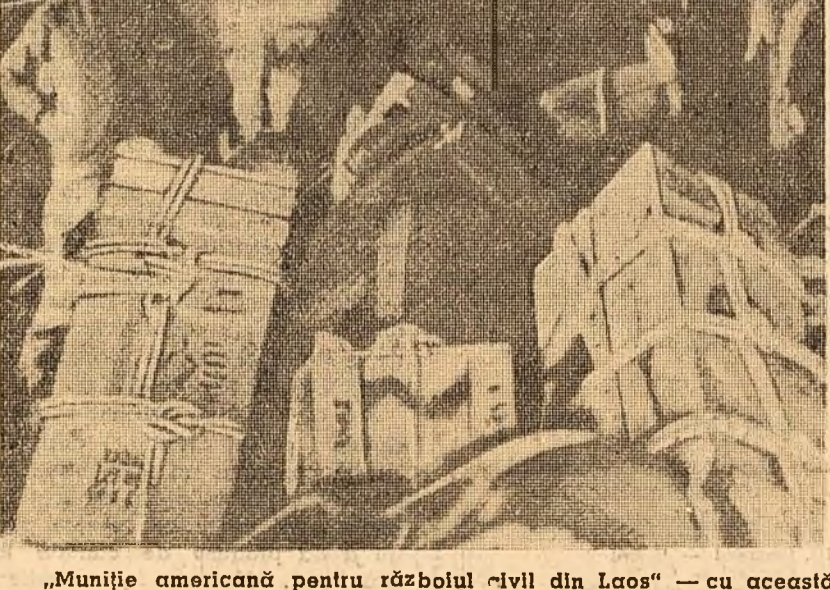
„Muniție americană pentru războiul civil din Laos” — cu această explicație „Die Welt” însoțește fotografia de mai sus, executată de autorul reportajului, J. Bassat.

„Desigur, dar am îmbătrînit, ca să spun așa, în ea, și în afară de aceasta, îse bani frumoși. Am nevoie de ei. Familia mea trăiește la Miami. Acolo viața nu este chiar infernală”.