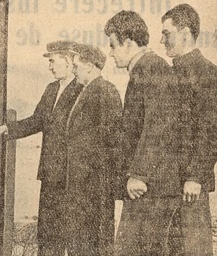
Colectiviștii discută cu mult interes despre dezvoltarea gospodăriei lor.