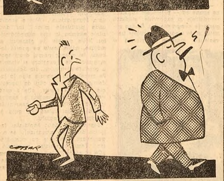
(Desen de NELL COBAR)

In S.U.A., cheltuielile pentru ajutoarele de șomaj ce se dau temporar celor aruncați pe drumuri de capitaliști, sînt suportate de fapt tot de oamenii muncii.