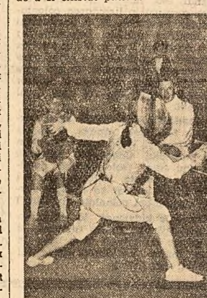
In sala Tineretului din Capitală s-au disputat întrecerile finale ale campionatelor republicane de scrimă pentru juniori.

In această primăvară, cu soare cald și aer senin, pe patinoarul artificial din Capitală, un public numeros, pasionat și competent a urmărit jocurile de hochei pe gheață din cadrul urneului final al campionatului național. Niciodată sezonul nu s-a ajuns pînă la această filă de calendar. De aceea nu fără incântătoare surpriză am asistat zile la dispută celor mai bune echipe angajate în lupta pentru cucerirea titlului de campioni a țării.