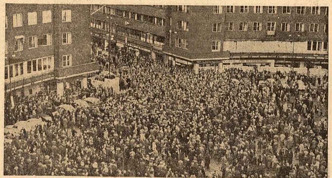
Aspect de la marea demonstrație a oamenilor muncii care a avut loc recent în capitala Norvegiei împotriva înarmării atomice.

Amintirea lui Serghei Mironovici Kirov care și-a închinat întreaga viață fericirii poporului, pîldă lui însuși luptător pentru comunism și pace va rămîne de-a pururi vie în inimile tuturor comunistilor, ale luptătorilor pentru pace, democrație și socialism.