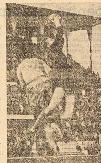
C. CONSTANTINESCU coresp. voluntar

Fază din meciul Petrolul — Steagul Roșu (Fotografia din dreapta).