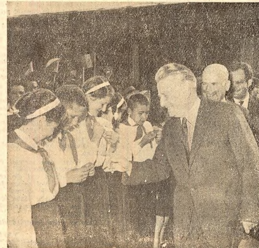
Pe peronul gării Galați, tovarășul Antonin Novotny dăruiește copililor insigne pionieresti cehoslovace.