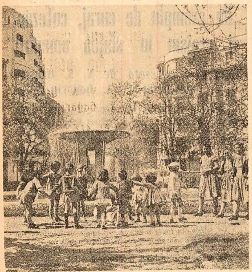
Dimineața de aprilie în Capitală.

Sute de tineri din orașul Pitești, membri ai brigăzilor U.T.M. de