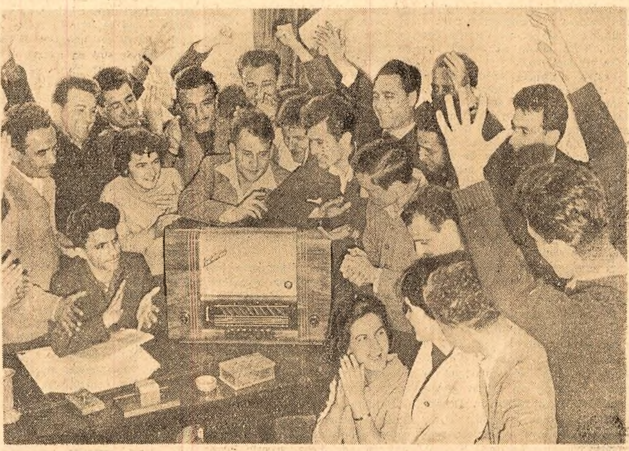
Un instantaneu grăitor al bucuriei și entuziasmului cu care au primit studenții Institutului Politehnic din Capitală, vestea epocalei realizări a științei și tehnicii sovietice.