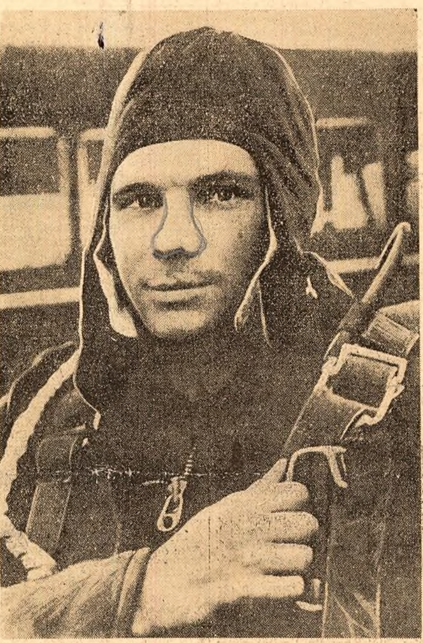
IURI ALEXEEVICI GAGARIN

Maiorul Iuri Gagarin a aterizat în bune condiții în regiunea stabilită din U. R. S. S.