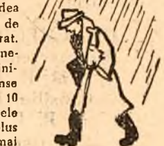
Dimineața de aprilie în Capitală.