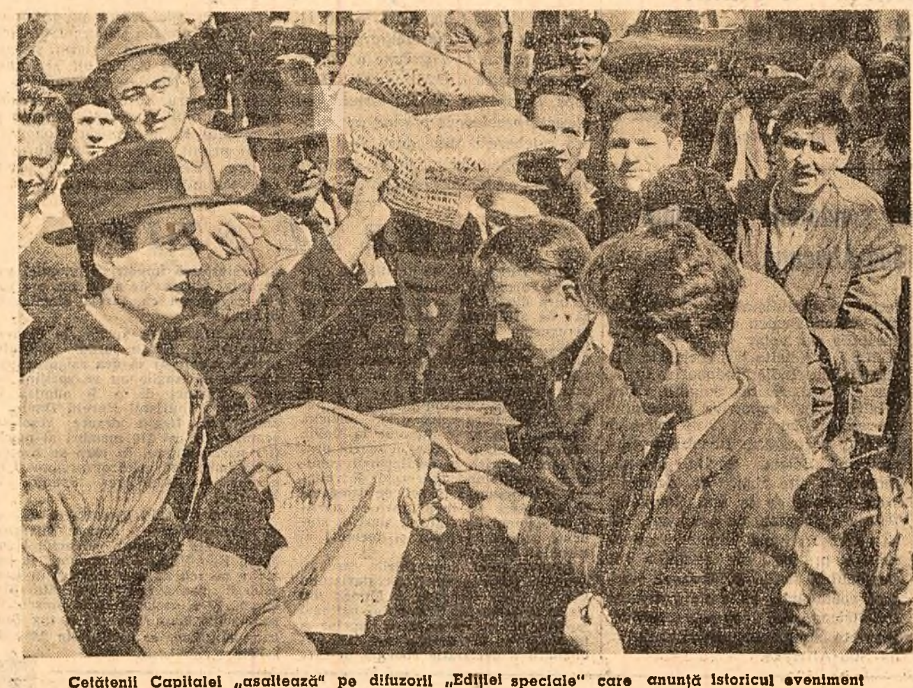
Cetățenii Capitalei „asaltează” pe difuzorii „Ediției speciale” care anunță istoricul eveniment

Indelungatele experiențe pe animale pe pămînt și la bordul rachetelor au arătat că suprasarcinile și vibrațiile în timpul plasării pe orbită, imponderabilitatea în timpul zborului nu constituie piedici în calea îndeplinirii zborului. De asemenea, nu constituie o piedică nici influența suprasarcinilor la revenirea navei pe Pămînt. Mult mai complicată a fost problema verificării influenței asupra organismului a acelor condiții fizice care au loc dincolo de păturile dense ale atmosferei. Au fost necesare