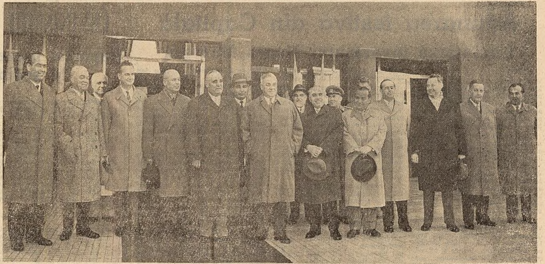
Pe peronul gării Băneasa, la plecarea delegației

Sîmbătă după-amiază a părăsit Capitala, îndreptându-se spre Varșovia, delegația Comitetului Central al Partidului Muncitoresc Român și a guvernului R. P. Române care, la invitația Comitetului Central al Partidului Muncitoresc Unit Polonez și a guvernului Republicii Populare Polone, face o vizită de prietenie în Polonia.