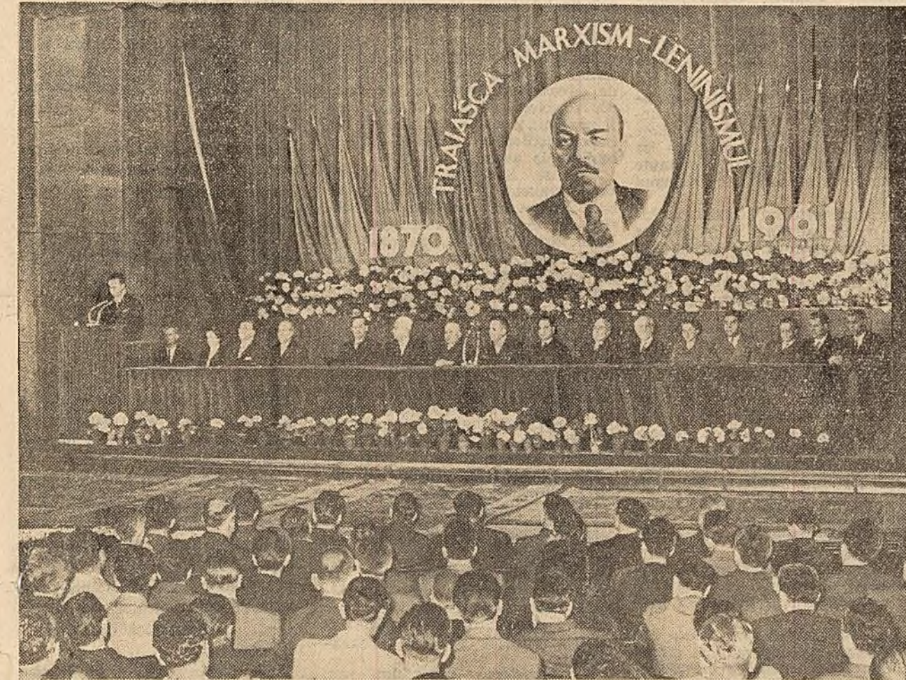
Prezidiul adunării festive de la Teatrul C.C.S.

Ministerul Agriculturii recomandă să se continue cu toate forțele semănăturii porumbului. Să se ia măsuri pentru îndeplinirea planului de însămînțare înfrăscă și pentru intensificarea însămînțării legumelor, cartofilor, a plantelor de furaj, precum și pentru terminarea lucrărilor de îngrijire a pășunilor și fînejelor naturale.