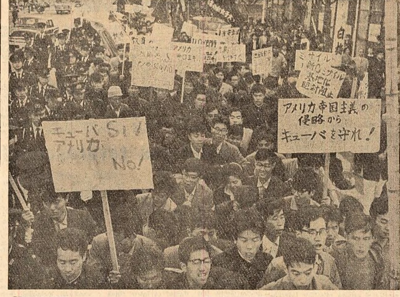
Circa 15.000 de muncitori și studenți din Tokio au demonstrat în fața ambasadei S.U.A. din capitala Japoniei condamnînd agresiunea imperialistă împotriva Cunei.

NEW YORK 28 (Agerpres). — Vădit enervat de faptul că presa americană a publicat materiale care dezvăluie adevăratul rol al S. U. A. în pregătirea și înfăptuirea invaziei militare în Cuba, președintele a atras atenția ziaristilor, într-un discurs rostit la Biroul publicității al Asociației editorilor de ziare din America, asupra necesității „de a păstra un mult mai mare secret oficial”.