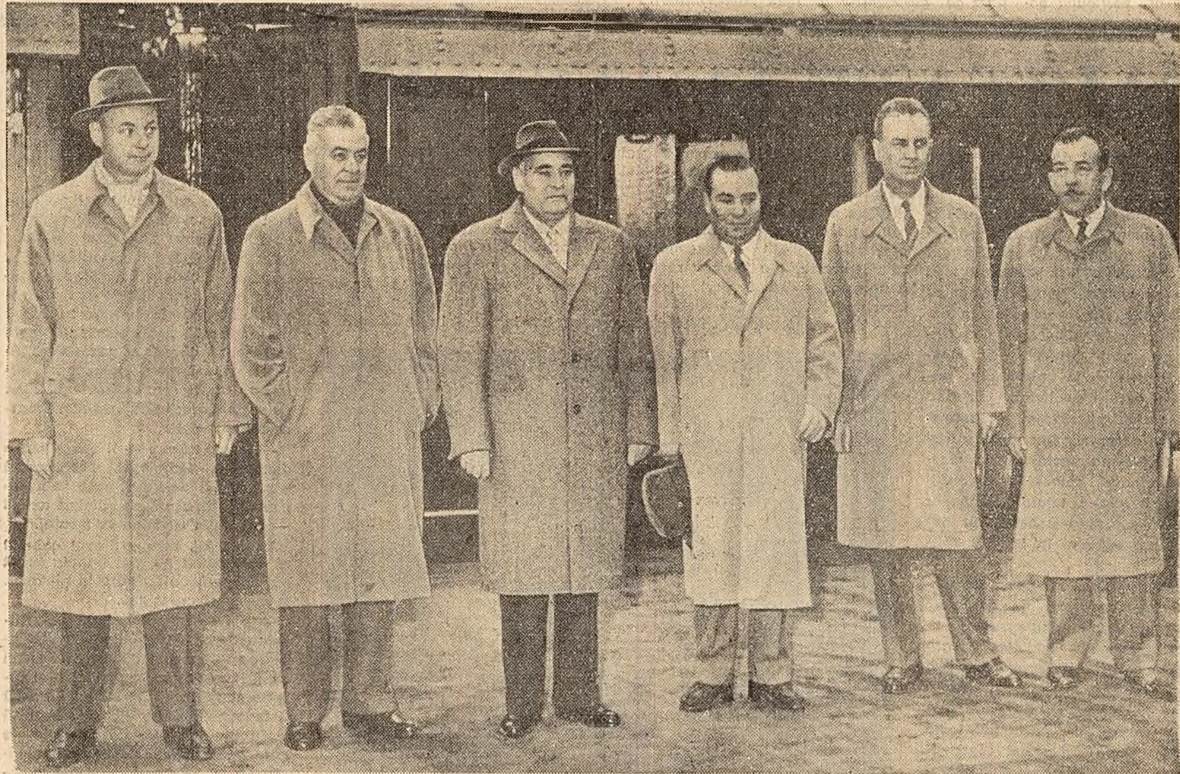
Pe peronul Gării Băneasa

Duminică dimineața s-a înapoiat în Capitală, venind de la Varsovia, delegația Comitetului Central al Partidului Muncitoresc Român și a guvernului Republicii Populare Romine care, la invitația Comitetului Central al Partidului Muncitoresc Unit Polonez și a guvernului Republicii Populare Polone, a făcut o vizită de prietenie în Polonia.