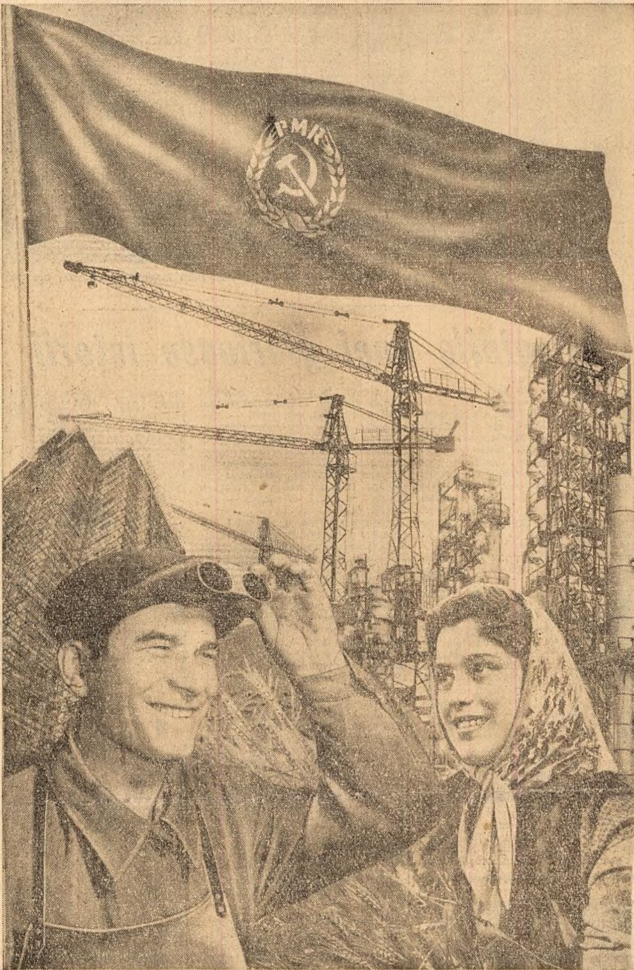
(Fotomontaj de M. ANDRESCU)