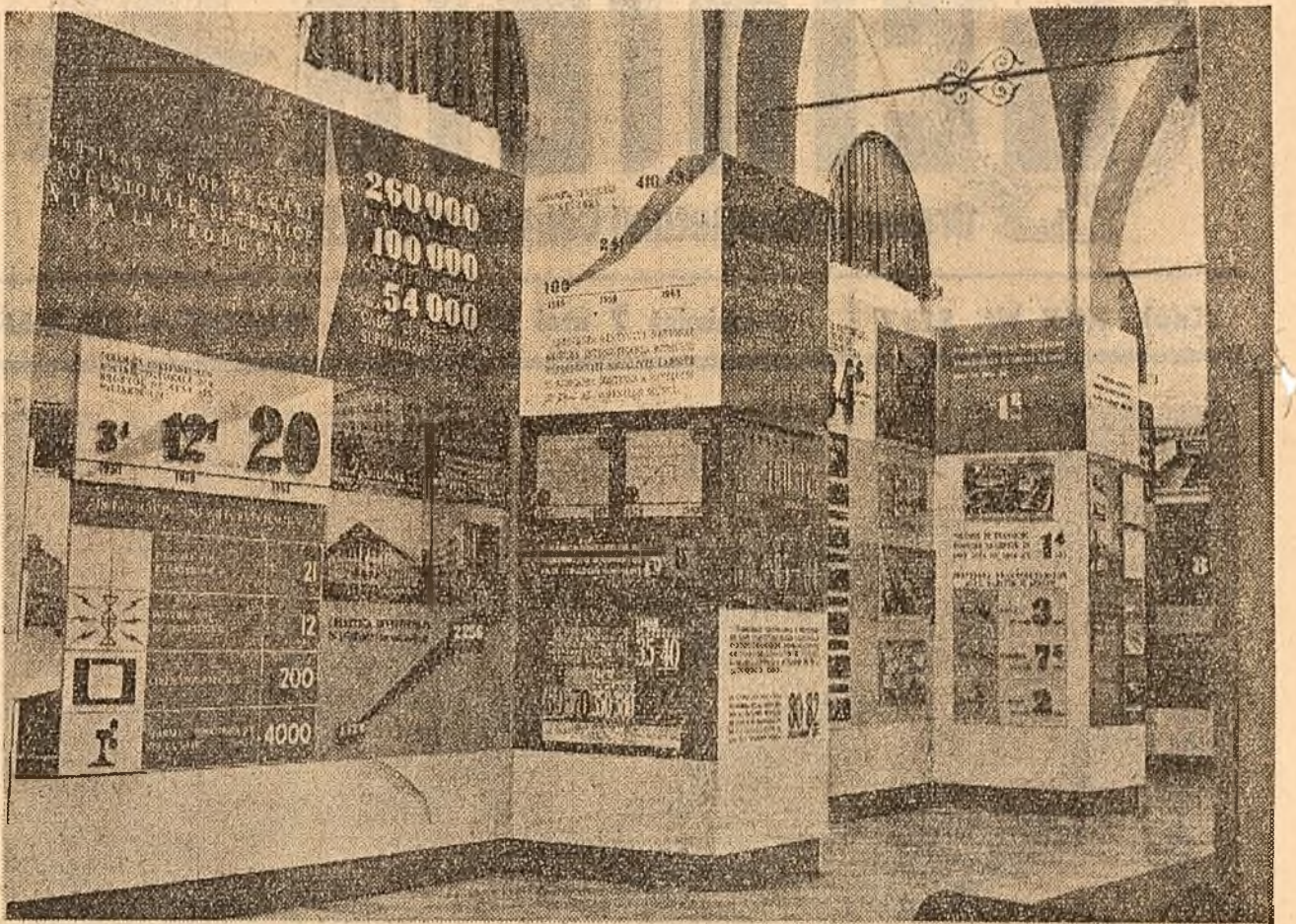
Aspect din noua sală închinată Congresului al III-lea al Partidului Muncitoresc Român, inaugurată ieri la Muzeul de Istorie a partidului.

Asemenea întîlniri au avut loc în toate regiunile țării. Ele au constituit un nou prilej pentru tineretul din patria noastră de a-și manifesta hotărîrea de a urma neabătut politica Partidului Muncitoresc Român, de a participa cu tot elanul lor tineresc, cu toată pricepera, la opera de desăvîrsire a construirii socialismului.