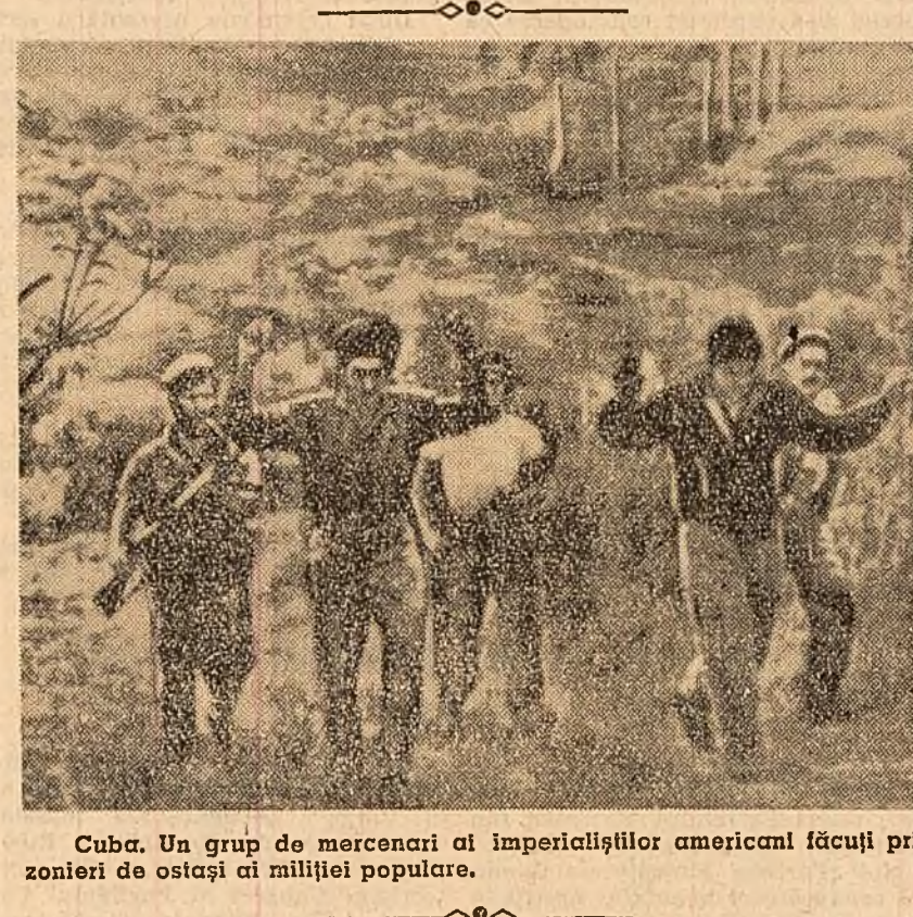
Cuba. Un grup de mercenari ai imperialismului american făcând prizonieri de ostazi ai miliei populare.

HANOI 6 (Agerpres). — Delegația guvernului R. D. Vietnam care va participa la Conferința internațională pentru reglementarea problemei laotiene a plecat la 6 mai la Geneva.