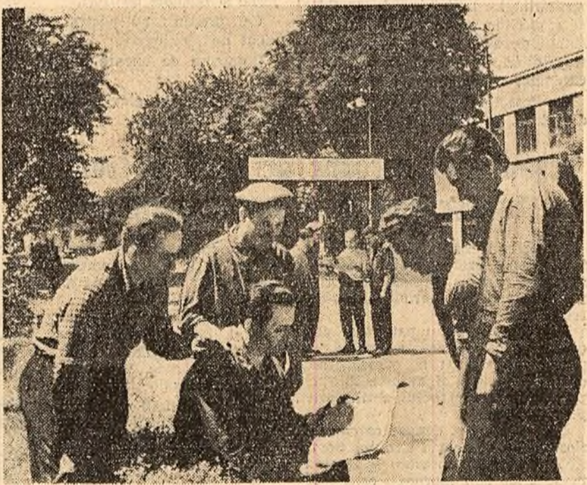
A sosit ziarul. În pauza de prînz, un grup de muncitori de la Atelierele C.F.R. „Grivița Roșie” din Capitală citește împreună Raportul prezentat de tovarășul Gheorghe Gheorghiu-Dej la adunarea festivă organizată cu prilejul aniversării a 40 de ani de la crearea Partidului Comunist din România.