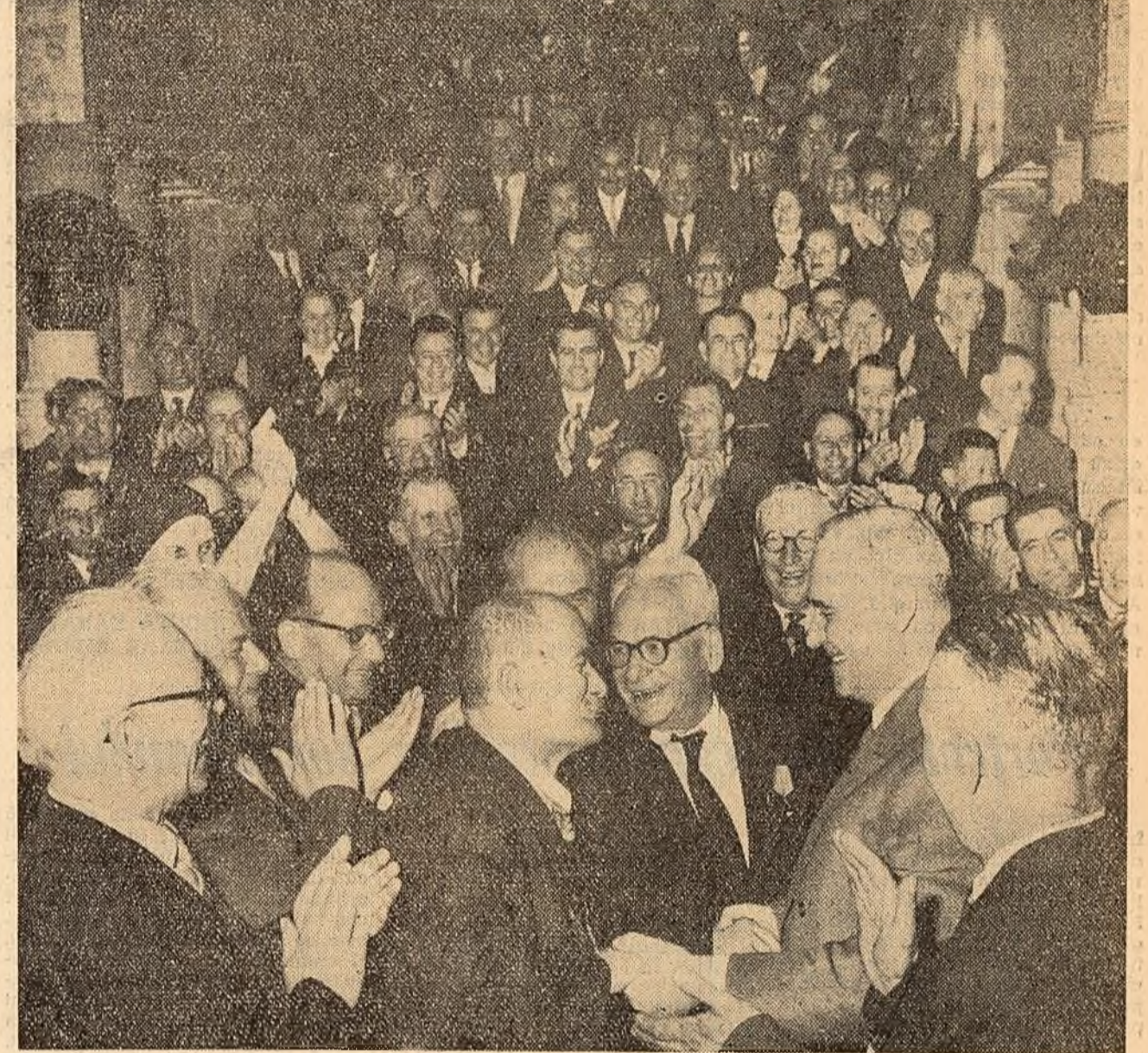
Cu o deosebită căldură a fost înconjurat tovarășul Gheorghe Gheorghiu-Dej de participanții la masa tovarășească organizată cu prilejul glorioasei aniversări a partidului.

Emoționante clipe. La plecare, în decorul modern, atît de drag tuturor cetățenilor Capitalei noastre, aici, în fața noii săli a Palatului R. P. Romîne — unde în urmă cu mai puțin de un an a avut loc istoricul Congres al III-lea al P.M.R. — conducătorii partidului se fotografiază împreună cu veterani ai mișcării muncitorești, cu reprezentanții oamenilor muncii veniți din toate regiunile țării.