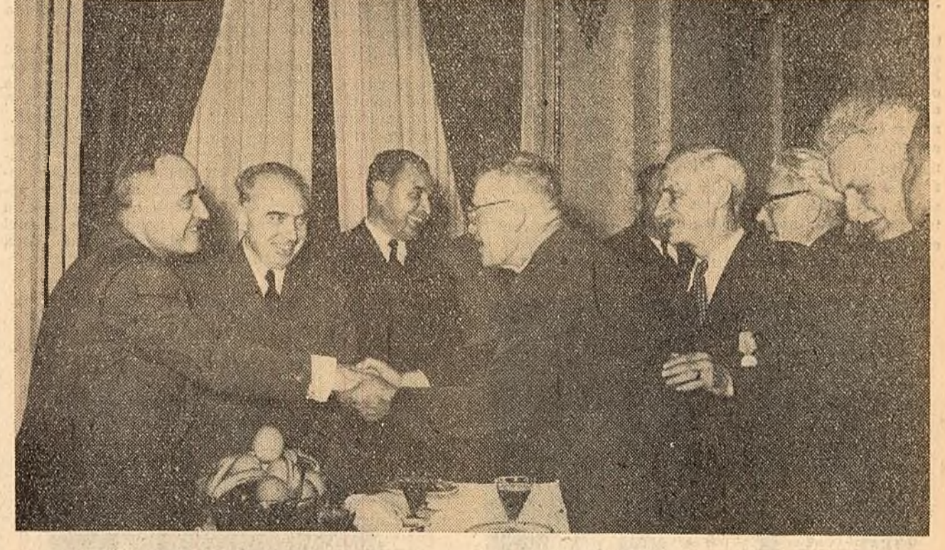
Participanții la masa tovarășească au felicitat din inimă pe conducătorii partidului.