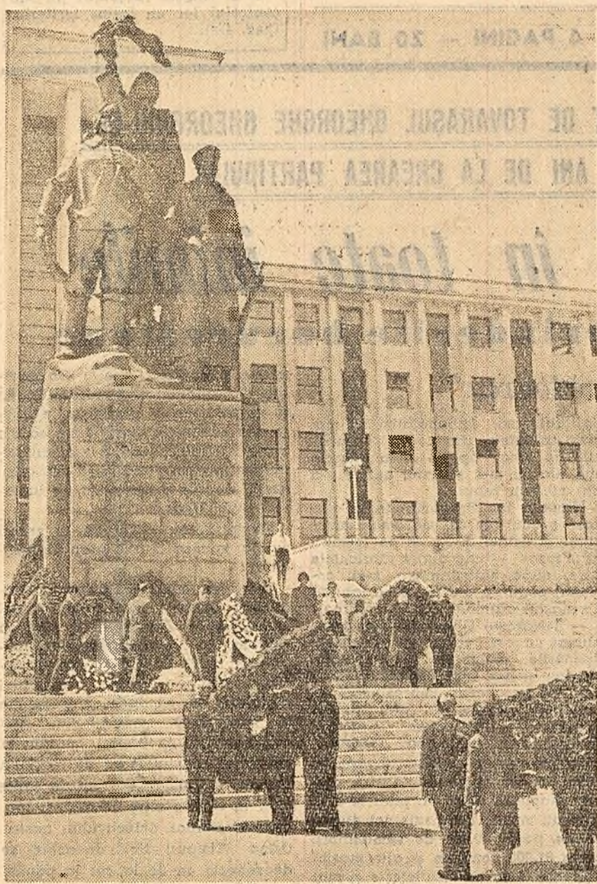
Cu prilejul Zilei Victoriei, în Capitală și în numeroase alte orașe ale țării au avut loc depuneri de coroane în amintirea celor căzuți în lupta pentru înfrângerea fascismului. În fotografiile: La Monumentul Eroilor Patriei (stînga sus), la Monumentul Eroilor Sovietici (dreapta sus), la Cimitirul Militarilor Britanici (dreapta jos).