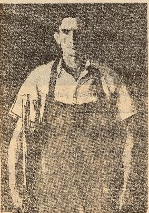
ALEXANDRU CIUCURENCU „Portret de muncitor (stînga)”

În portretele expuse artiștii s-au străduț să înfrunghie avîntul cerului, dragostea de patrie, înaltele trăsături morale ale constructorilor socialismului, cultivate de partid. Întîmpinarea însușită a universității celor patru decenii de la înființarea partidului a constituit pentru artiștii plastici un prilej de verificare și întărire a forțelor pentru a merge mai departe pe drumul larg deschis al progresului artei noastre realist-socialiste.