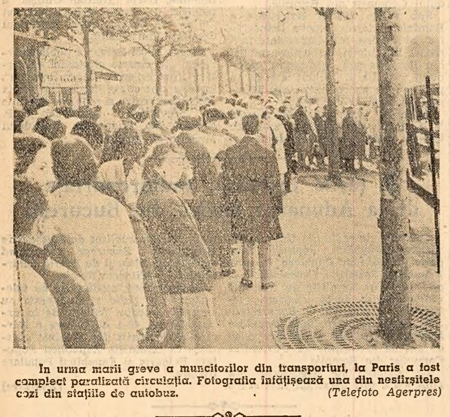
In urma marșului grevei a muncitorilor din transporturi, la Paris a fost complet paralizată circulația. Fotografia înfățișează una din nesfîrșitele cozi din stațiile de autobuz. (Telefoto Agerpres)

OSLO 9 (Agerpres). — Corespondenții agenției TASS, V. Vavilov, transmite: La Oslo a început o vastă campanie de protest împotriva planurilor agresive ale N.A.T.O. În dimineața zilei de 8 mai numeroși norvegieni și adversari ai înarmării atomice din alte țări au ieșit pe străzile capitalei. Ei au organizat o demonstrație care va continua fără întrerupere zi și noapte în tot cursul sesiunii N.A.T.O. „Jos N.A.T.O.!”; „Să fie interzise armele atomice!”; „Dezarmare!” — acestea sînt lozincile lansate de partizanii păcii. Luni seara mii de norvegieni s-au adunat în piața centrală din Oslo. Printre ei erau oameni de convingeri politice diferite. Ei sînt uniți de dorința comună de a face totul pentru preîntîmpinarea izbucnirii unui război.