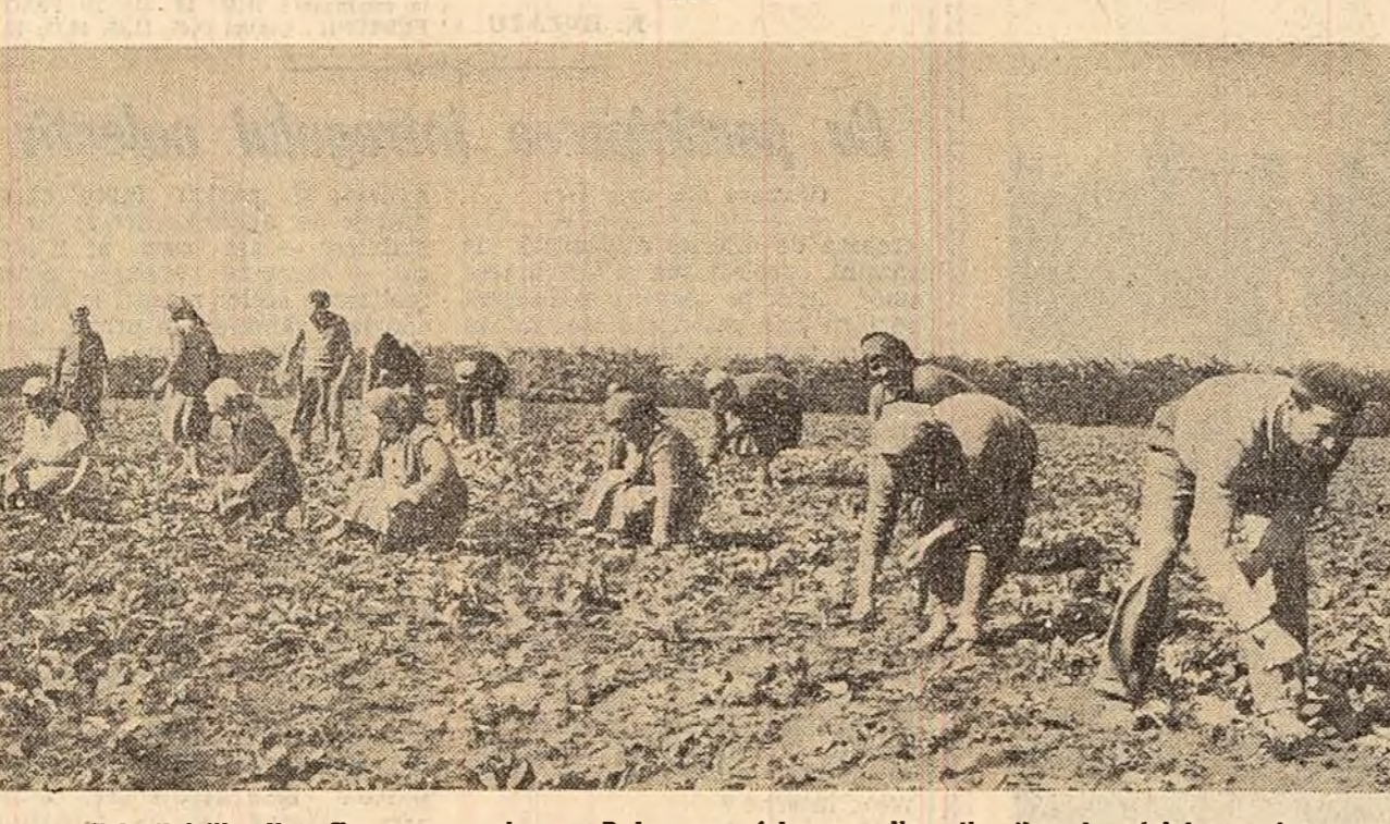
Colectivități din Comana, regiunea Dobrogea, folosesc din plin timpul prielnic pentru executarea lucrărilor de întreținere a culturilor. În fotografie: O parte dintre colectivitățile care lucrează la răritul sfeclii de zahăr.