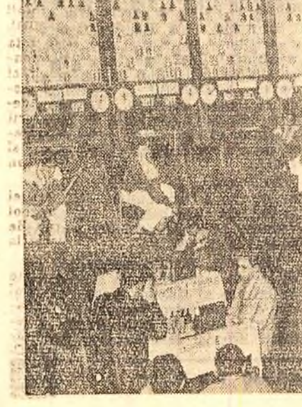
În fotografie: aspect din timpul partidelor de șah.

Din cele 8 partide ale primului tur s-au terminat 3: Polihroniade — Gavrilasvili 1-0, Soos — Gheorghidze 1/2-1/2, Tognidze — Nicolau 1-0. Celelalte partide s-au întrerupt și vor fi continuente astăzi de dimineață în Aula Bibliotecii Centrale Universitare din Capitală.