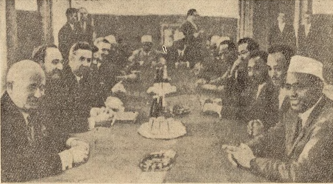
La Kremlin, în timpul tratativelor sovieto-germane în problema colabonării economice, tehnice și culturale (fotografia de sus).

scos în evidență necesitatea urgentă a încheierii tratatului de pace cu cele două state germane ca o condiție importantă pentru lichidarea urmărilor celui de-al doilea război mondial și prin aceasta a fazei de război din Europa, precum și pentru rezolvarea problemei Berlinului occidental.