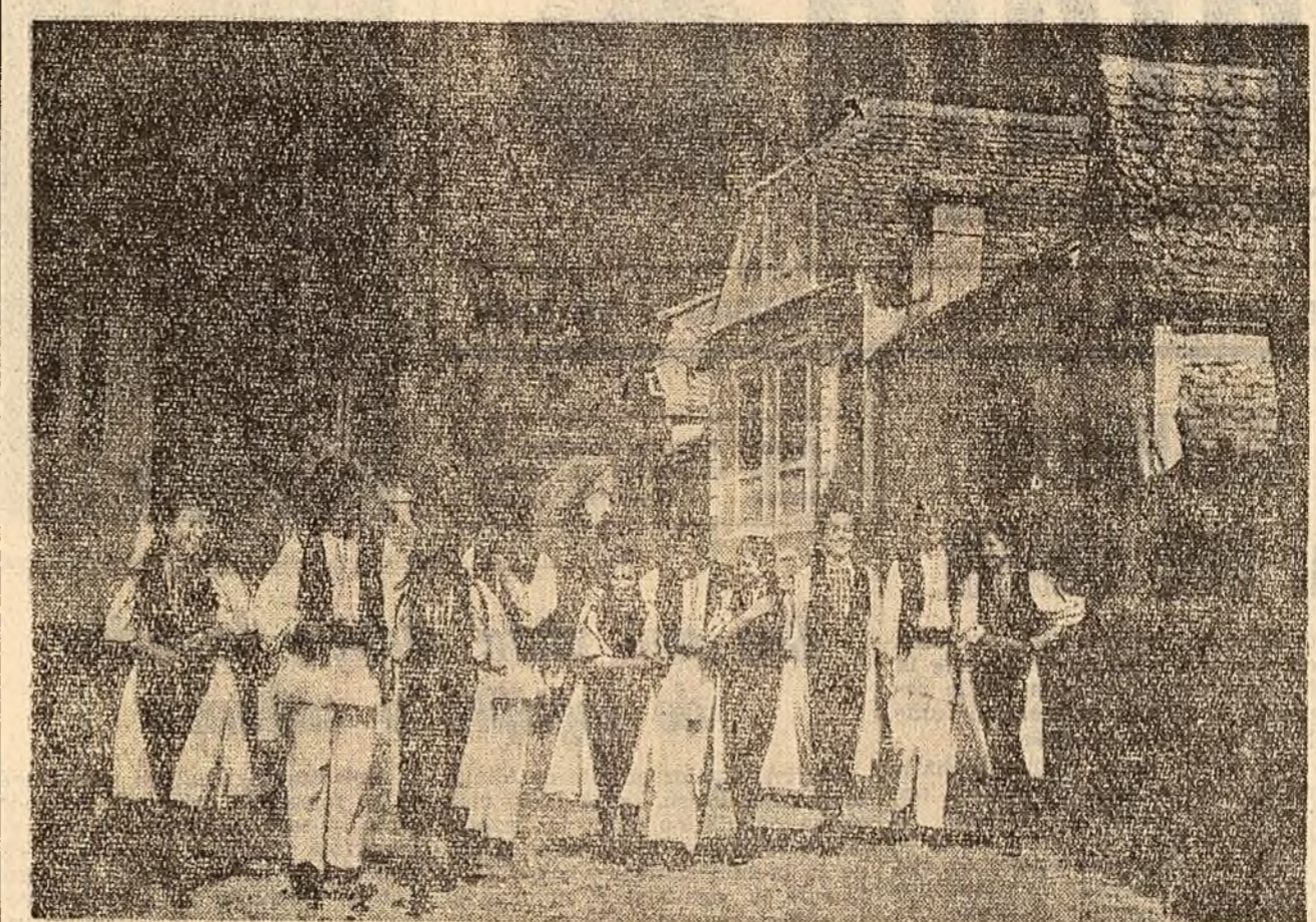
Zi de sărbătoare la Rășinari.