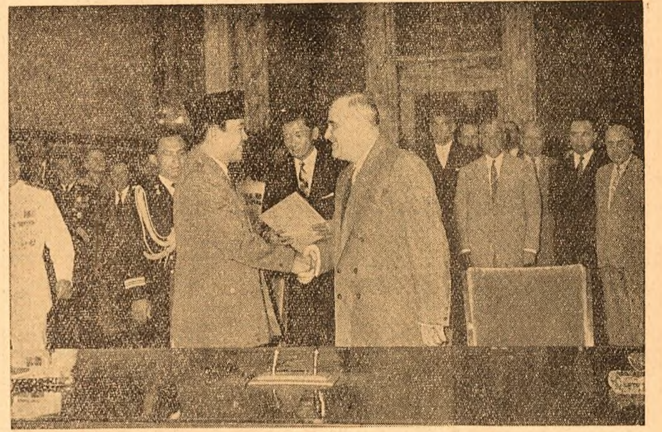
Tovarășul Gheorghe Gheorghiu-Dej și dr. Sukarno după semnarea Protocolului

La Consiliul de Miniștri al R. P. Romîne a avut loc luni dimineața solemnitatea semnării Protocolului privind dezvoltarea în continuare a colaborării economice și tehnice și intensificarea în ambele sensuri a comerțului între Republica Populară Romîna și Republica Indonezia.