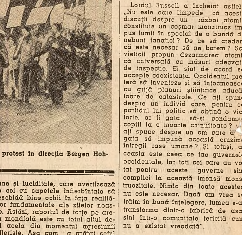
Partizanii din Hamburg și Bremen au întreprins un marș de protest în direcția Bergen Hohne, unde sînt experimentate rachetele ale Bundeswehrului.