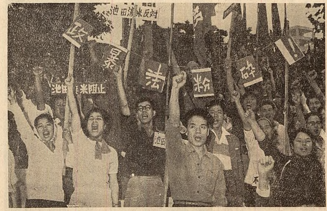
Mari demonstrații de protest, la care au participat 10.000 persoane, au avut loc la Tokio împotriva câștigătorii premiului Nobel la Washington, prin care s-a urmărit întărirea alianței militare cu S.U.A.

Referindu-se la propunerile în problema germană cuprinsă în ultimele declarații ale lui N. S. Hrușciov, Nehru a relevat caracterul periculos al situației din Berlinul occidental.