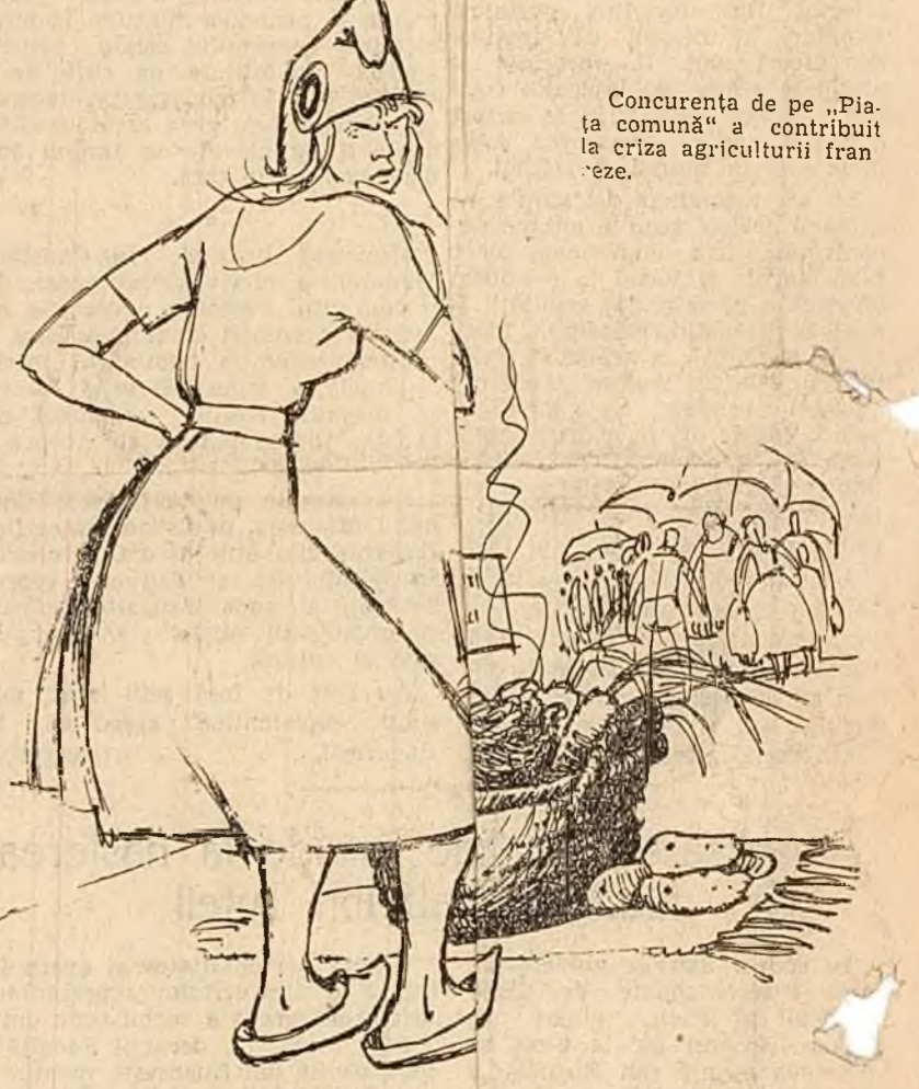
- Ce a devenit „comun” la piață o că produsele agricole nu se mai vind

Concurența de pe „Piața comună” a contribuit la criza agriculturii franceze.