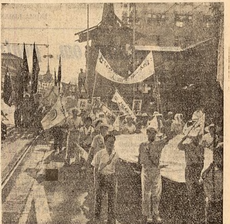
JAPONIA: Participanții la „Marșul păcii” început la 14 iulie la Hiroșima vor săi zilele acestea la Tokio unde vor participa la lucrările celei de-a 7-a Conferințe mondiale împotriva bombelor atomice și cu hidrogen.

„Lichidarea războaielor, instaurarea unei păci tricolore pe pămînt — iată misiunea istorică a comunismului”. Cuvintele programului răsună în lumea în-