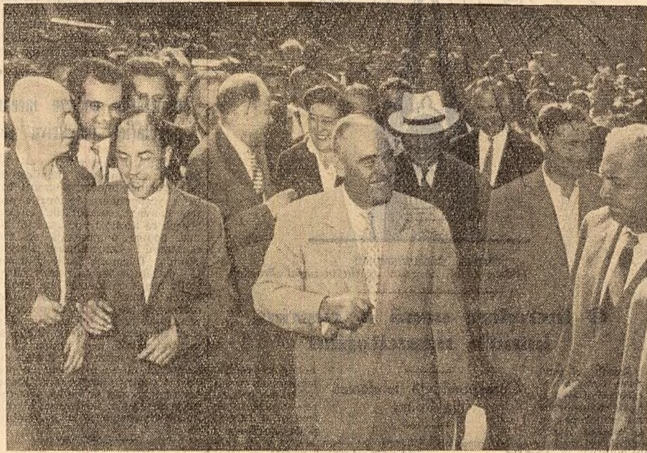
Tovarășul Gh. Gheorghiu-Dej împreună cu ceilalți membri ai delegației de partid și guvernamentale a R. P. Romine în vizită la Uzina de rulmenți nr. 1 din Moscova.

Delegația noastră s-a oprit îndelung lângă mașina automată de sortare și controlul rulmenților, un adevărat „academician” tehnic care „știe” singur să sorteze rulmenții pînă la diferențe de microni și să descopere fisuri, îndalțurînd rulmenții rebutați. Asemenea mașini de sortare și control automat sînt în număr de 250 în întreaga uzină. Ele fac operațiile pe care, în mod obișnuit, le-ar face 2000 de controlori. Muncitorul a devenit actiul — un muncitor de tip nou, înzestrat cu cunoștințe înalte, un adevărat inginer.