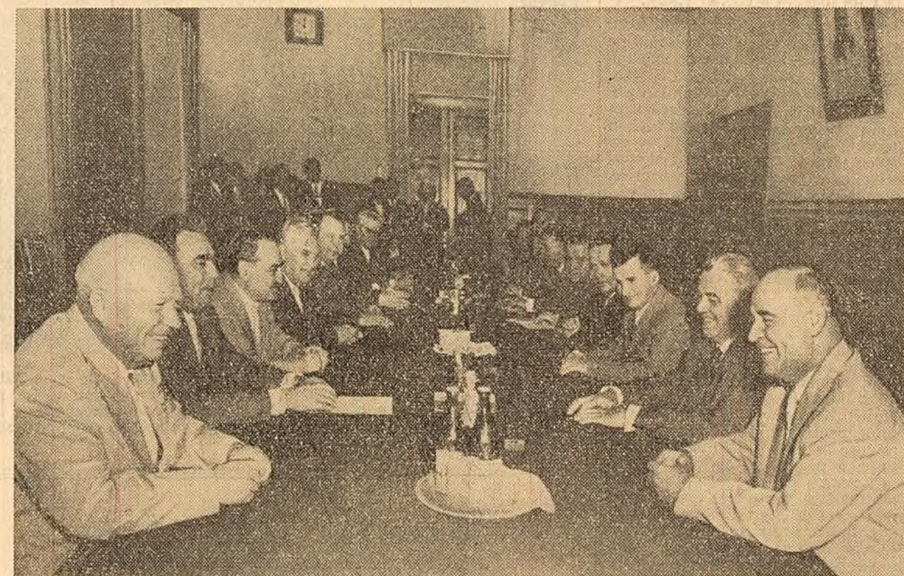
În timpul convorbirilor dintre delegația de partid și guvernamentală a R. P. Romîne și conducătorii ai P.C.U.S. și ai guvernului sovietic.