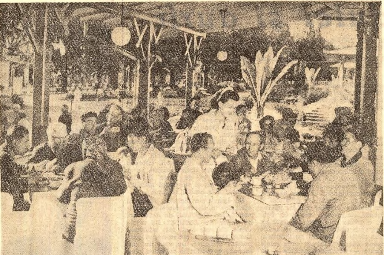
În stațiunea Călimănești, oamenii muncii le sînt asigurate condiții bune de odihnă și tratament. În fotografie: un aspect al sălilor de mese de la cantina centrului.