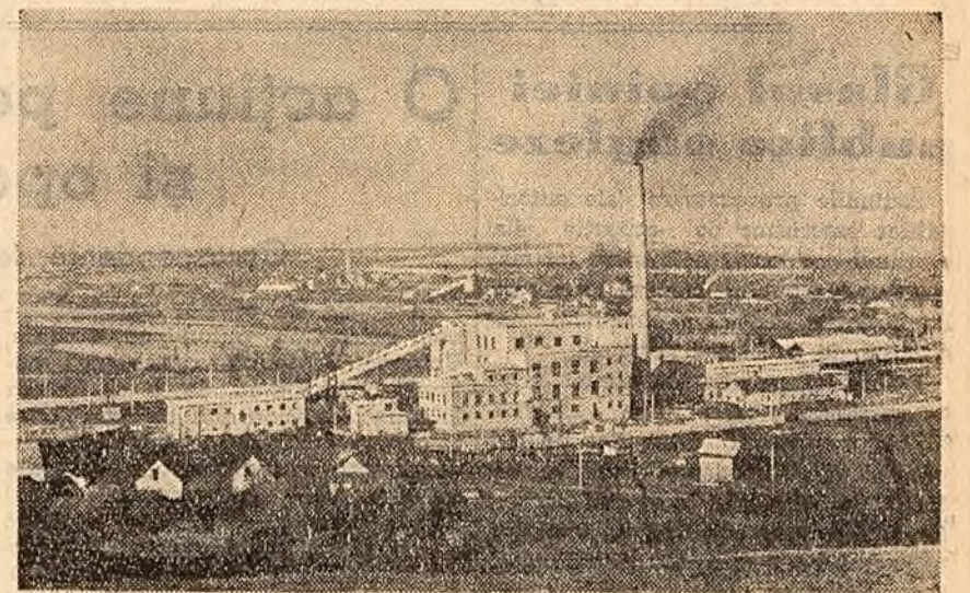
Fabrica de brichete din lignit de la Hidas — unul din importante obiective industriale din Republica Populară Ungară.