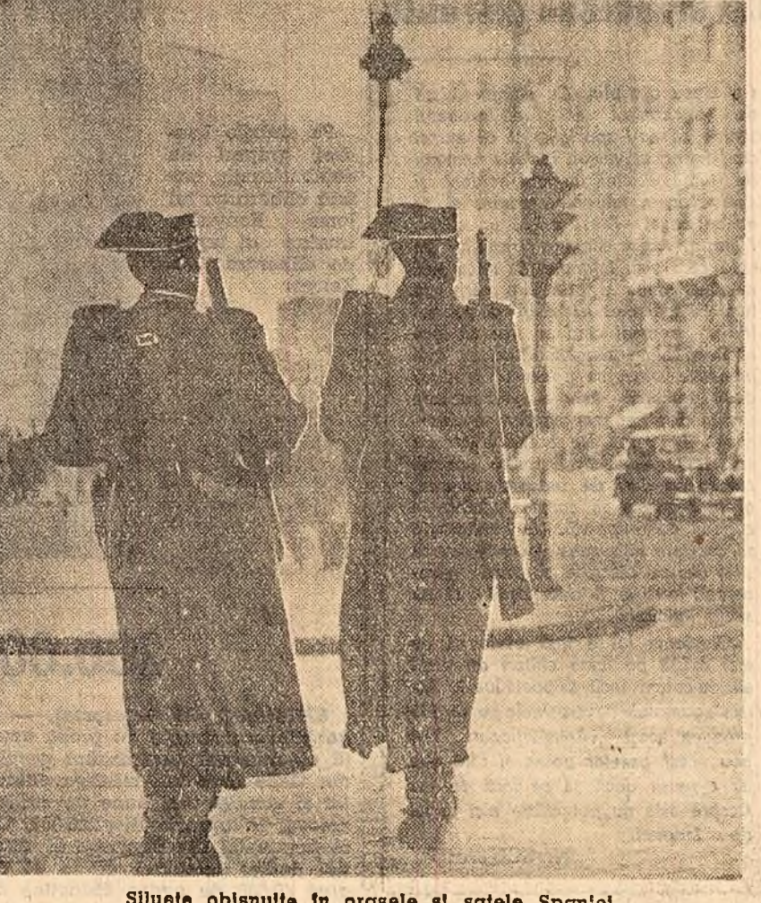
Siluețe obișnuite în orașele și satele Spaniei.

Tempul lui Franco a trecut. O gene-rație nouă populează fabricile și auditoriile universităților spaniole. Ea a tras învățămîntele din trecut și și-a prezentat revendicările în fața viito-rului. Licidarea dictaturii falangiste, înstituirea unei adevărate democrații naționale, o reformă agrară radicală, lichidarea cenzurii clericale asupra vie-ții spirituale. Ea nu va formula numai revendicările, ci va și să obțină cele cerute.”