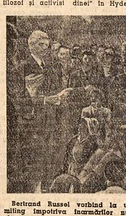
Bertrand Russel vorbind la un miting împotriva înarmărilor nucleare pe pămîntul britanic

Așadar, lordul Russel este „vinoval” de faptul că, vorbind despre pace, n-a făcut-o în șoapetă. În timp ce alt lord, Home, ministrul de Externe, vorbește împotriva păcii, iar cuvintele sale sînt amplificate de cele mai perfecționate aparate.