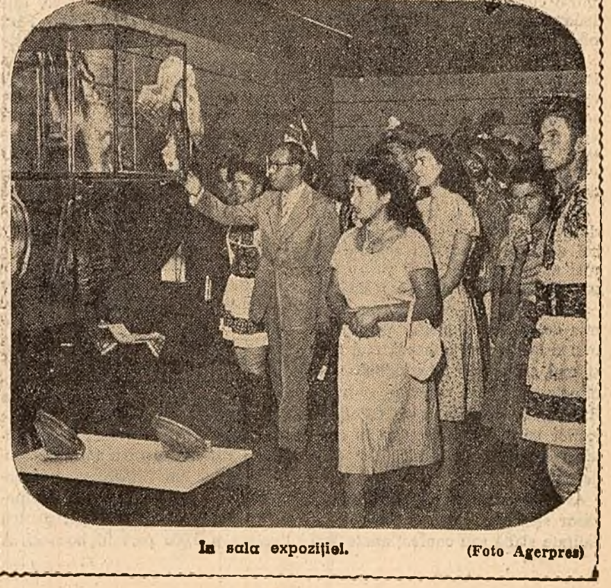
În sala expoziției.