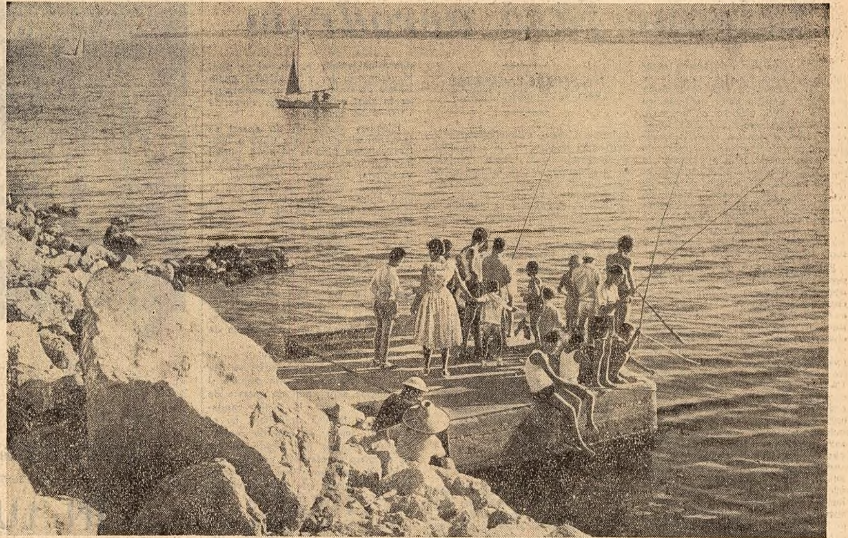
În concediu, la pescuit.

„Mnecați miere, savurați hrănitoarea ei dulceață. Undeva, ca în regiunea Galați, de pildă, niște oameni calmi, răbdători, culeg rodul stupilor, îngrijindu-l, păstoriind roșurile în păduri parfumate, usurându-le munca. Și în fiecare zi călduroasă, miile de albine colindă florile bălților și ale Deltei, aducînd picul de nectar care ajunge la noi în tone dulci și aurii de miere.