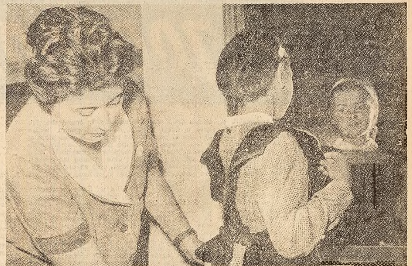
Prima uniformă! — În aceste zile, mulți părinți vizitează magazinul „Trei ursuleți” din Capitală, cumpărînd copiilor lor uniforme pentru noul an școlar.