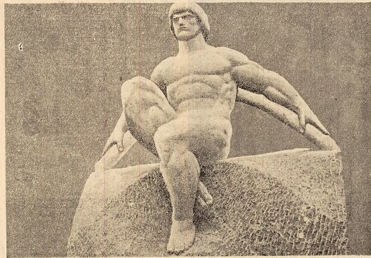
În atelierul de cioplitorie de la Mogoșoaia al Fondului Plastic se transpun, în marmură și piatră, lucrările de artă monumentală ale sculptorilor noștri clasici și contemporani. Ele vor împodobi stațiunile de pe litoral, precum și în multe orașe ale țării. Una din lucrările realizate în ultimele zile este copia statuiei „Arcașul” creată în 1926 de sculptorul Ion Jalea, și pe care o reproducem în fotografia noastră.

Teatrul „C. Nottara” și „Municipal” prezintă în aceste zile spectacole teatrale pe estradele unor curi din Capitală. Astfel, Teatrul „Nottara” dă spectacole în grădina „9 Mai” cu piesele „Musafiri în țară”, (astă seară și sîmbătă 2 iulie), „Scandalosă legătură între Kettle și d-na Moon” (vineri 1 septembrie) și „În căutarea traordinarului” (duminică 3 septembrie). Teatrul Municipal prezintă la Arenele Libertății, spectacolele: „Regele și cîinele”, (astă seară), „Întoarcerea” (vineri 1 septembrie) și „Mamouret” (sîmbătă 2 și duminică 3 septembrie).