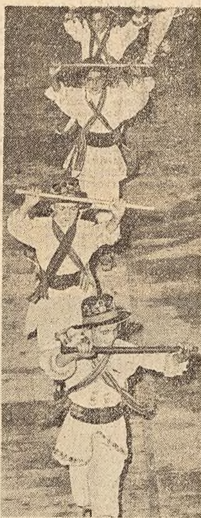
Copii din Pădurea-Argeș au adus pe scena concursului ritmul strădușului „călăș”. Formația lor a fost premiată la cel de-al VI-lea Concurs al artiștilor amatori.

Ideea studioului de televiziune de a realiza în colaborare cu studioul „Alex. Sahia” — un film documentar consacrat litoralului este, fără îndoială, bine venită.