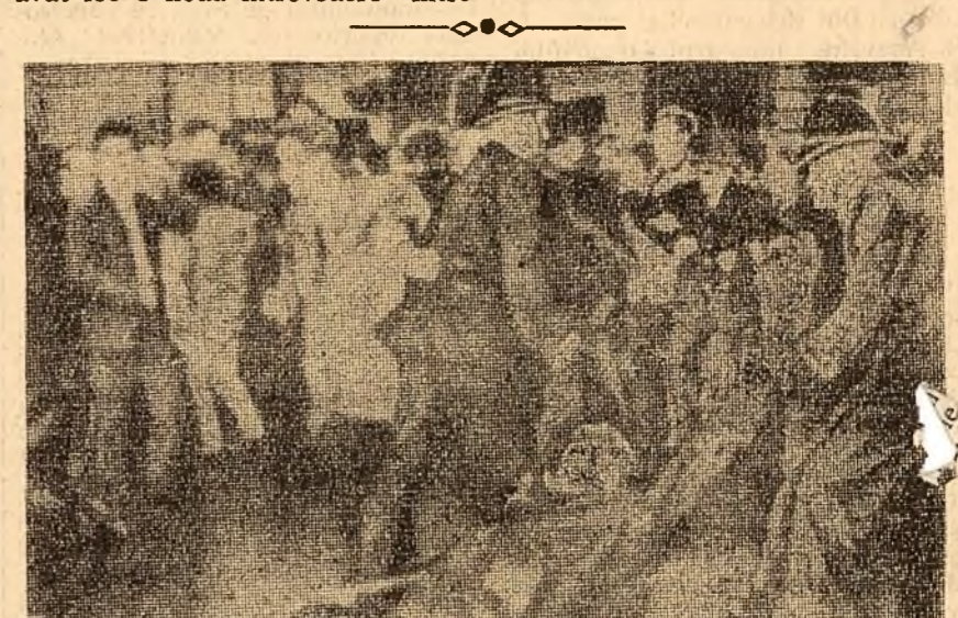
Pește 6.000 de englezi au participat la o demonstrație pe Trafalgar Square din Londra. Ei au protestat împotriva înarmării nucleare a Angliei. Autoritățile au trimis împotriva demonstrațiilor, poliția. Un mare număr de demonstrații au fost arestați. În fotografie: Polițiștii arestează în mod brutal un demonstrant.

NEW YORK 28 (Agerpres). — Luind cuvîntul la 27 septembrie, în ședința Adunării Generale a O.N.U., în sprijinul repartizării problemei dezarmării generale și totale în dezbaterile ședințelor plene ale Adunării Generale a O.N.U., ministrul Afacerilor Externe al R.P. Romine, Corneliu Mănescu, a declarat printre altele: