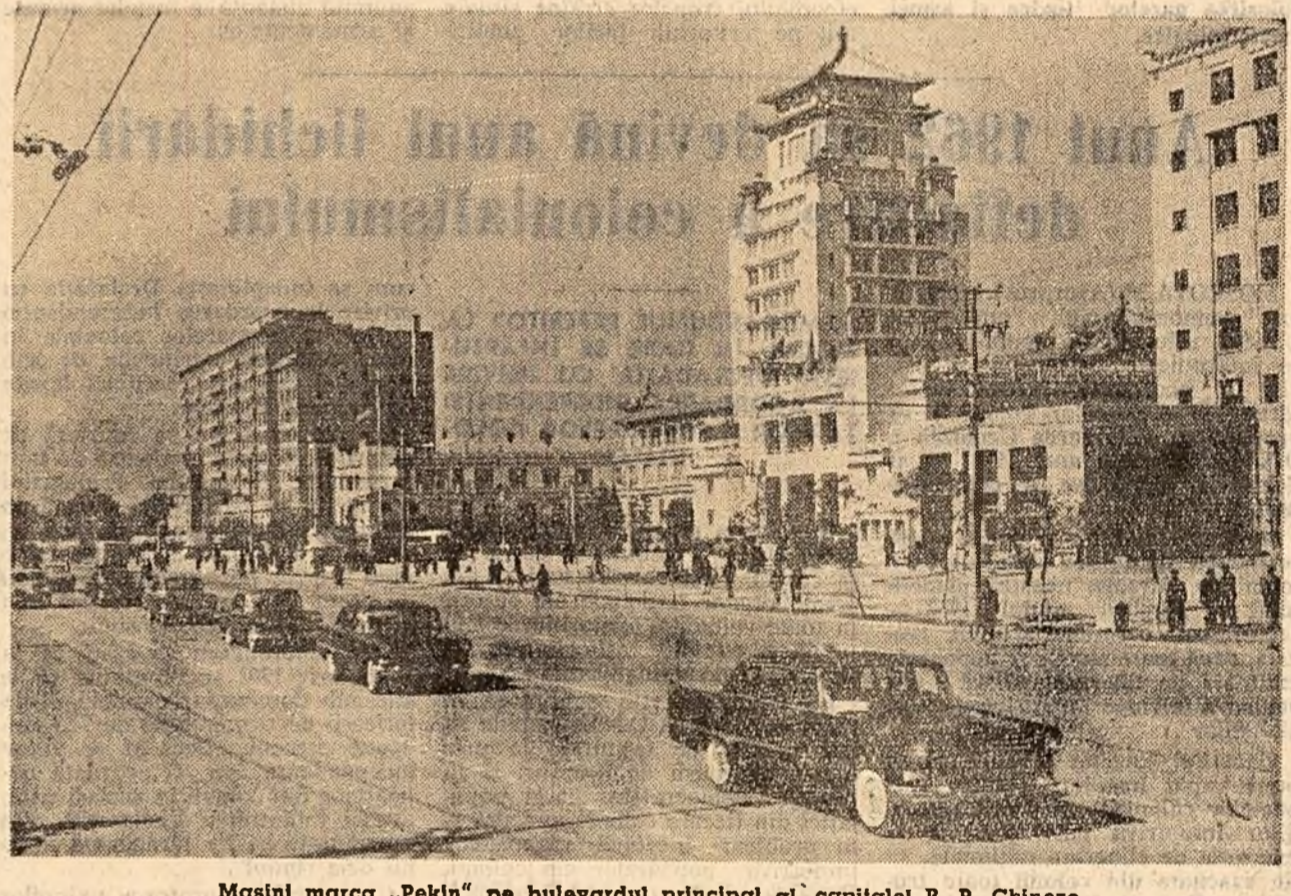
Mașini marca „Pekin” pe bulevardul principal al capitalei R. P. Chineze.

MOSCOVA 28 (Agerpres). — TASS: Grupul de ziaristi sovietici care nu au putut ajunge la New York la începutul celei de-a XVI-a sesiuni a Adunării Generale a O.N.U., deoarece nu au obținut vize de intrare în S.U.A. au adresat reacției ziarului „Pravda” o scrisoare deschisă, în care se spune: După cum se vede, manevrele în legătură cu acordarea de vize ziaristilor sovietici urmăresc să împiedice comentarea de către ei a lucrărilor acestui sesiuni, care trebuie să discute probleme internaționale de cea mai mare importanță. Această poziție a Departamentului de Stat străngește nedumerirea legiților a reprezentanților presei sovietice, a întregii opinii publice sovietice.