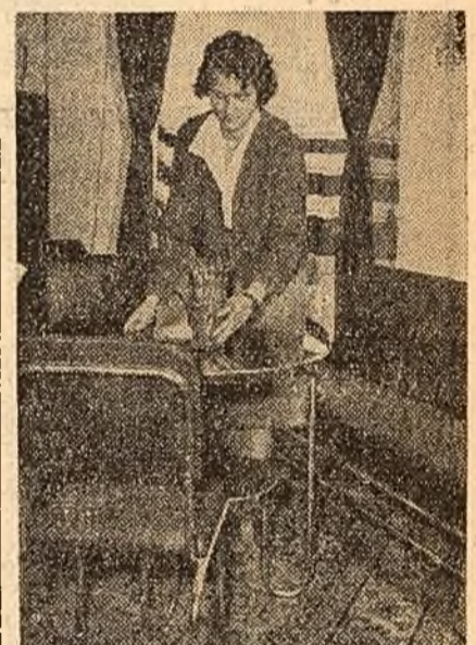
Colectivul întreprinderii metalurgice „Răsăritul” din Capitală pregătește pentru cel de-al III-lea Pavilion de mostre peste 150 produse. Între acestea se numără și mobilierul de material plastic destinat spitalelor, instituițiilor etc.

LA 27 SEPTEMBRIE s-au deschis congresele partidelor comuniste din R.S.S. Ucraineană, R.S.S. Kazahă, R.S.S. Estonă, R.S.S. Lituaniană, R.S.S. Gruzină și R.S.S. Moldovenească. De asemenea la Minsk și la Riga își continuă lucrările congresele partidelor comuniste din R.S.S. Bielorusă și R.S.S. Letonă.