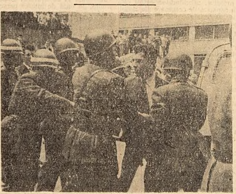
Un aspect din timpul grevei generale a funcționarilor bancari din Columbia. În fotografie: Poliția operează arestări din rîndul greviștilor.

PARIS 10 (Agerpres). — La 10 octombrie Henri Raynaud, secretar al Confederației Generale a Muncii, a fost ales președinte al Federației naționale a Asiguratorilor sociale în locul reprezentantului Uniunii scioniste a sindicatelor „Force Ouvriere”, care și-a dat demisia. Acesta este un mare succes al mișcării muncitorești franceze. Reprezentantul C.G.M. va conduce această puternică organizație, care are un important rol în sistemul asigurărilor sociale din Franța.