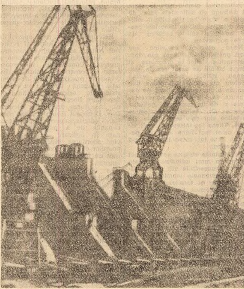
Construcții hidrocentrale ce se ridică pe Kamă în apropiere de Volkînsk și-au îndepărtat cu cinste angajamentul luat în cinstea Congresului al XXII-lea al P.C.U.S. sîngăndu-se apela Kamel. În decembrie, cu un an înainte de termen, vor intra în funcțiune primele două agregate ale acestui nod hidroenergetic. În fotografie: un aspect de la hidrocentrala de lângă Volkînsk.

săpători ar avea nevoie de 2.000 de ani. Uriașele excavatoare de acest tip vor fi folosite pentru exploatarea în carieră a marilor zăcăminte de substanțe minerale utile descoperite în Uniunea Sovietică în ultimii ani. Ele vor putea efectua lucrările de dezvelire și vor putea extrage minereul de la o adîncime de 600 metri și transporta totodată minereul pînă la 300 metri de locul exploatarei.