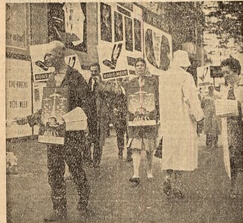
Luptătorii pentru pace din Belgia au organizat în portul și orașul Anvers manifestații de protest împotriva militarismului vest-german și a creării bazelor militare ale Bundeswehrului în Belgia cerind totodată recunoașterea R. D. Germane și a frontierei Oder-Neisse. În fotografie: participanții la demonstrație distribuie manifeste cetățenilor.

BONN 10 (Agerpres). — Ziarul vest-german „Die Andere Zeitung” se ocupă într-un articol de fond de falimentul politicii Bonnului care refuză cu încăpăținare să recunoască existența a două state germane și nu renunță la planurile agresive de cucerire a Republicii Democratice Germane. Declarațiile unor oameni politici și publiciști englezi și americani, scrie ziarul „Die Andere Zeitung”, arată că ei sînt gata să recunoască existența celor două state germane și frontiera pe Oder-Neisse, că sînt