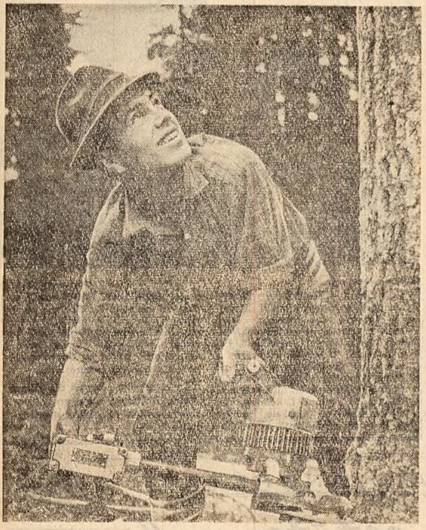
Tăierea buștenilor cu fierăstrăul electric. (La unitatea Giumdlău a întreprinderii forestiere Cimpulung Moldovenesc).

Un nou bloc de locuințe în centrul orașului Pitești. La parter sînt în curs de amenajare o librărie și un magazin de textile.